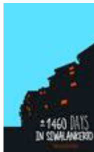
Gambar 7. Cover Depan

Berikut adalah beberapa gambar final dari desain buku panduan yang berjudul 1460 Days in Siwalankerto