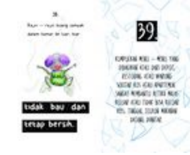
Gambar 54. Halaman 92-93