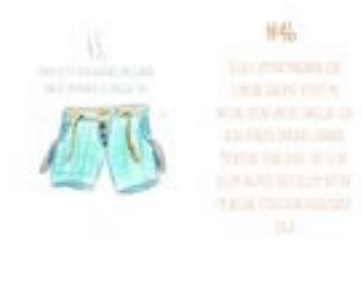
Gambar 58. Halaman 100-101