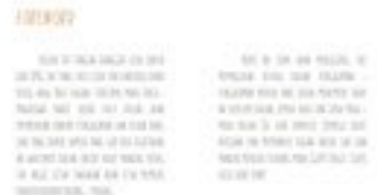
Gambar 11. Halaman 6-7