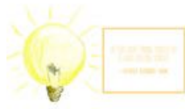
Gambar 62. Halaman 108-109