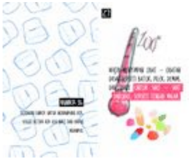
Gambar 47. Halaman 78-79