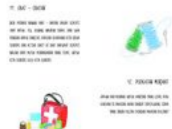
Gambar 31. Halaman 46-47