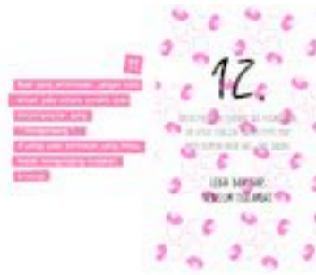
Gambar 38. Halaman 60-61