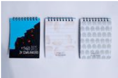
Gambar 66. Notes