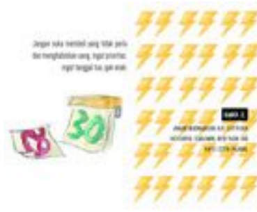
Gambar 49. Halaman 82-83