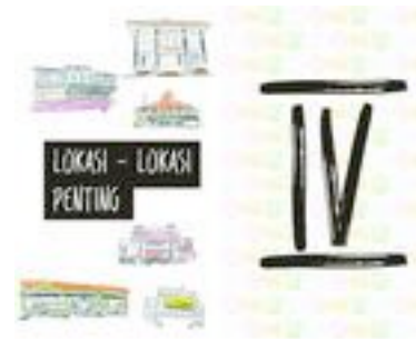
Gambar 20. Halaman 24-25