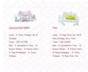
Gambar 22. Halaman 28-29