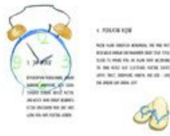
Gambar 27. Halaman 38-39