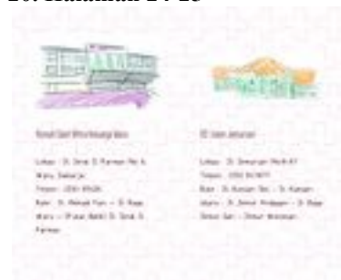
Gambar 21. Halaman 26-27