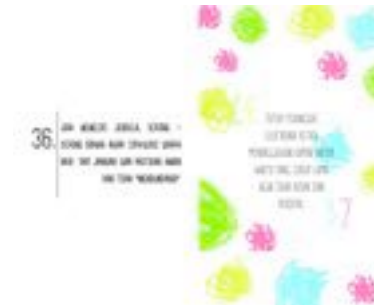
Gambar 53. Halaman 90-91