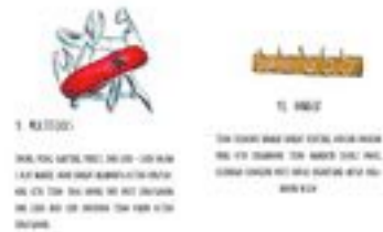
Gambar 30. Halaman 44-45