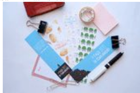
Gambar 73. Hasil pembatas buku