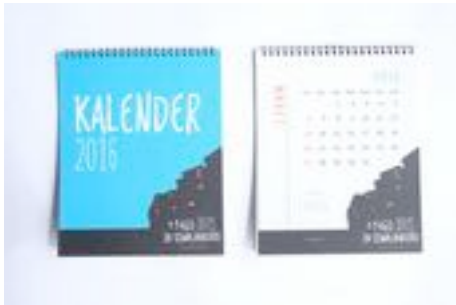
Gambar 65. Kalender 2016