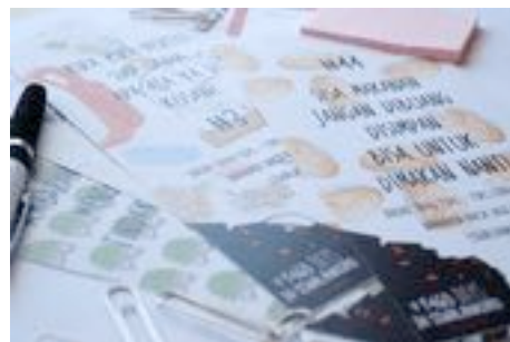
Gambar 72. Hasil brosur