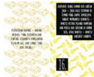
Gambar 40. Halaman 64-65