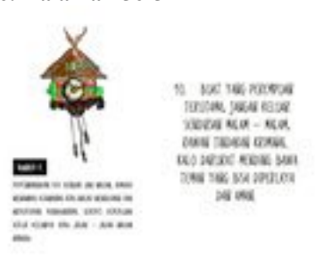
Gambar 37. Halaman 58-59