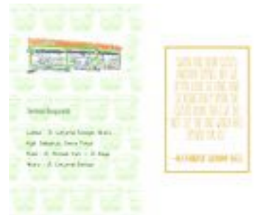
Gambar 24. Halaman 32-33