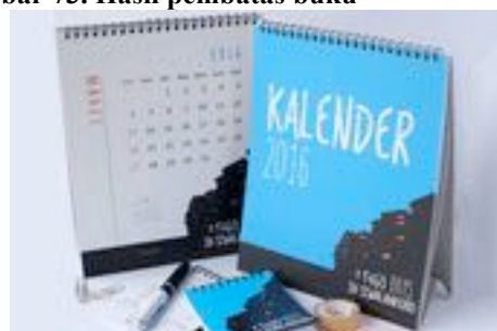
Gambar 74. Hasil kalender