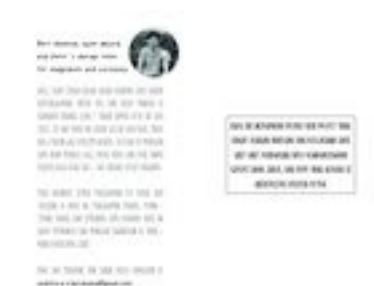
Gambar 63. Halaman 110-111