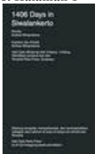
Gambar 9. Halaman 2-3