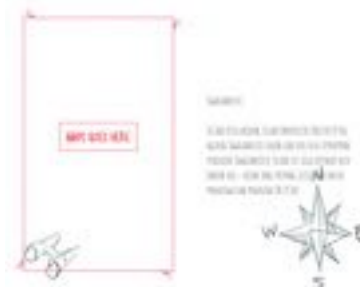
Gambar 13. Halaman 10-11