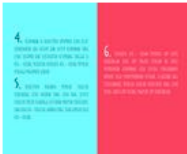
Gambar 18. Halaman 20-21