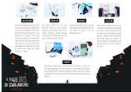
Gambar 76. Poster presentasi A2