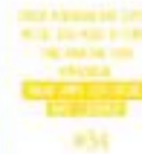
Gambar 51. Halaman 86-87