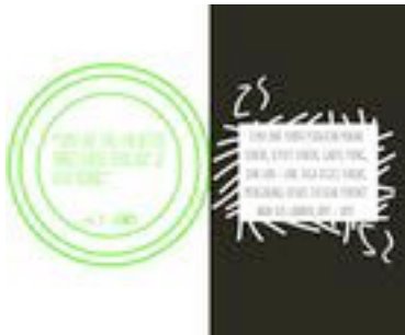
Gambar 46. Halaman 76-77