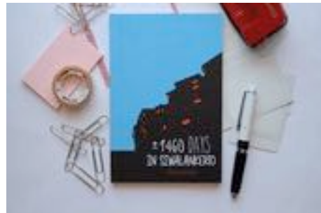
Gambar 71. Buku tampak depan