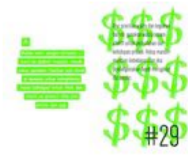
Gambar 48. Halaman 80-81