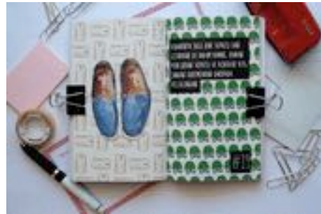
Gambar 70. Contoh halaman