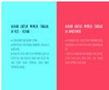
Gambar 19. Halaman 22-23