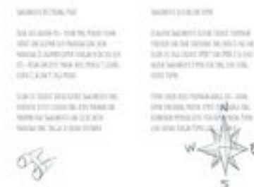
Gambar 14. Halaman 12-13