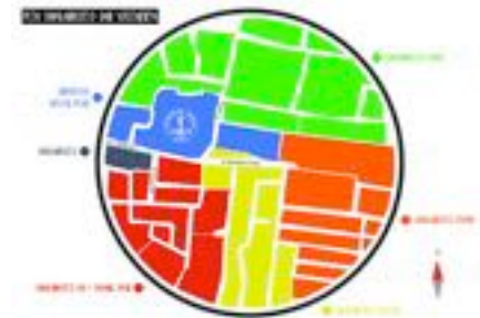
Gambar 81. Peta Siwalankerto A4