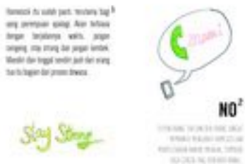
Gambar 33. Halaman 50-51