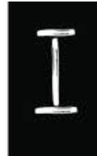
Gambar 10. Halaman 4-5