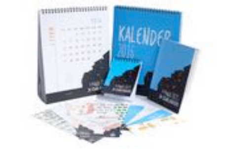
Gambar 69. Semua media final