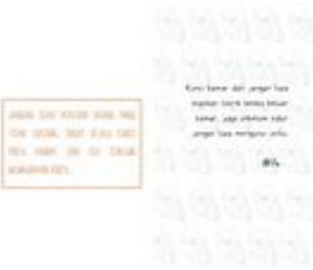
Gambar 39. Halaman 62-63