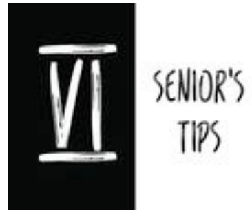
Gambar 32. Halaman 48-49