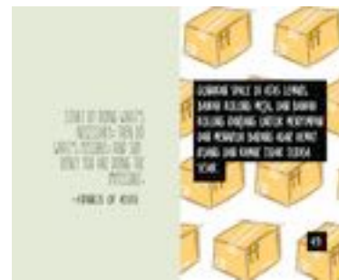
Gambar 60. Halaman 104-105