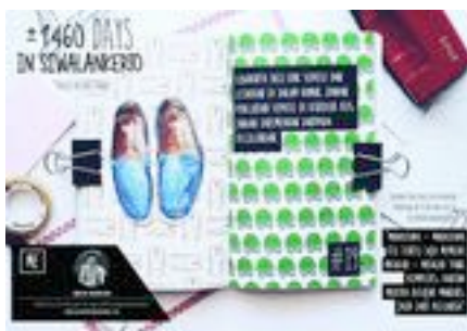
Gambar 79. Katalog bagian dalam