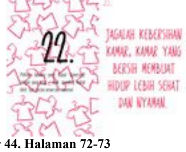
Gambar 44. Halaman 72-73