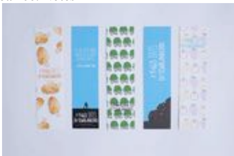
Gambar 67. Pembatas buku