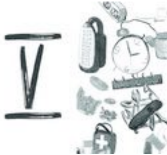
Gambar 25. Halaman 34-35