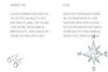
Gambar 15. Halaman 14-15