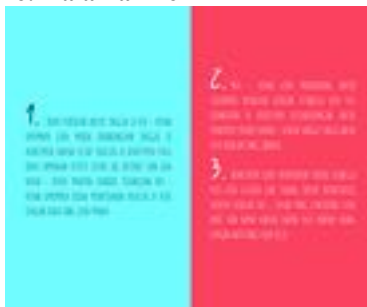
Gambar 17. Halaman 18-19