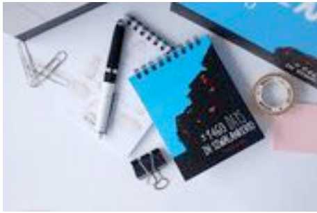
Gambar 75. Hasil notes