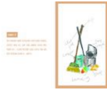
Gambar 45. Halaman 74-75

25. JANGAN TERBUKUKAN BUKU - BUKU YANG TERBUKUKAN DAPAT MENYERAP POLUSI DARI LUAR DAN BUKAN DAPAT MENYERAP POLUSI DARI LUAR DAN BUKAN DAPAT MENYERAP POLUSI DARI LUAR DAN BUKAN