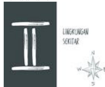
Gambar 12. Halaman 8-9