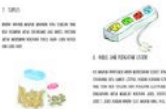
Gambar 29. Halaman 42-43