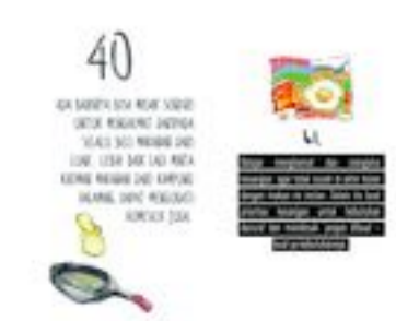
Gambar 55. Halaman 94-95