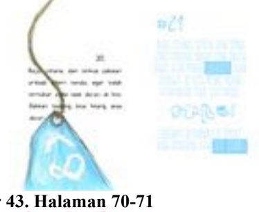
Gambar 43. Halaman 70-71