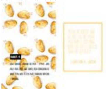
Gambar 57. Halaman 98-99