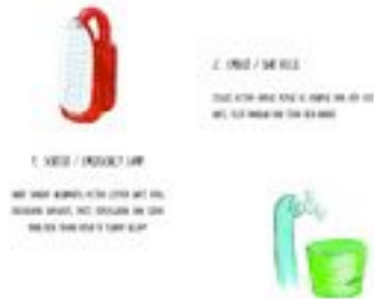
Gambar 26. Halaman 36-37