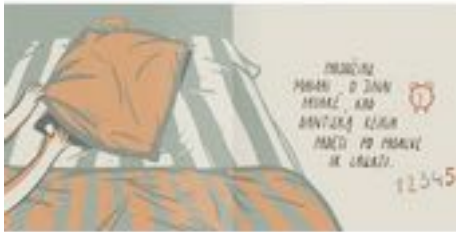
Gambar 6. Refrensi Layout

Gaya desain layout halaman yang akan digunakan adalah layout simetris sehingga penekanan terhadap poin – poin penting dapat langsung ditangkap oleh audiens. Layout akan berkisar 2 kolom sampai 3 kolom sesuai dengan kebutuhan konten tiap halaman. Juga perlu ditekankan bahwa layout akan bergantung kepada gaya desain yang digunakan sehingga tetap memberikan kesan yang sama dan saling mendukung.