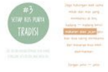
Gambar 34. Halaman 52-53