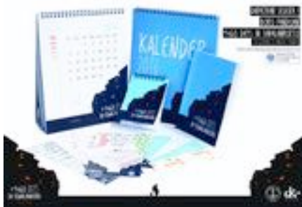
Gambar 77. Poster pameran A2