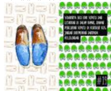
Gambar 42. Halaman 68-69