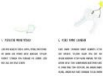
Gambar 28. Halaman 40-41