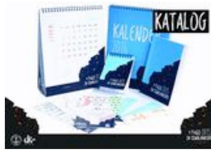
Gambar 80. Katalog bagian luar