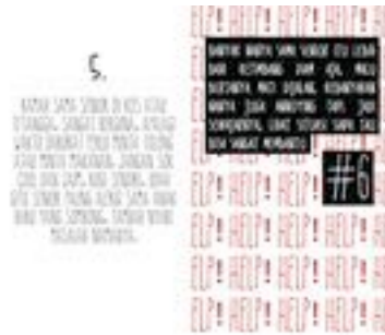
Gambar 35. Halaman 54-55