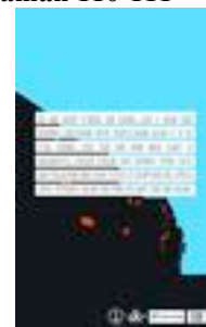
Gambar 64. Cover belakang