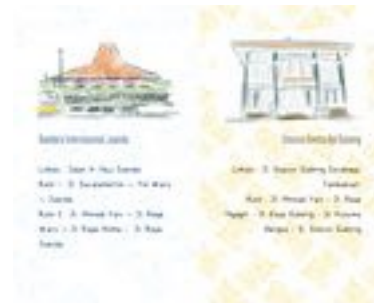
Gambar 23. Halaman 30-31