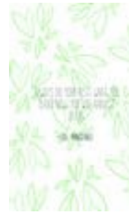
Gambar 52. Halaman 88-89