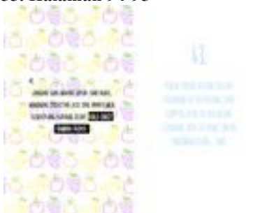
Gambar 56. Halaman 96-97