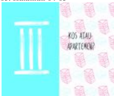
Gambar 16. Halaman 16-17