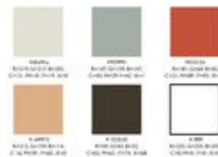
Gambar 1. Palet Warna

Penggunaan palet warna netral digunakan untuk memberi kesan simpel, minimalis, dan elegan. Selain itu agar keterbacaan jelas, tidak memberatkan audiens, dan tidak mengalihkan perhatian audiens ke elemen – elemen yang tidak diperlukan.