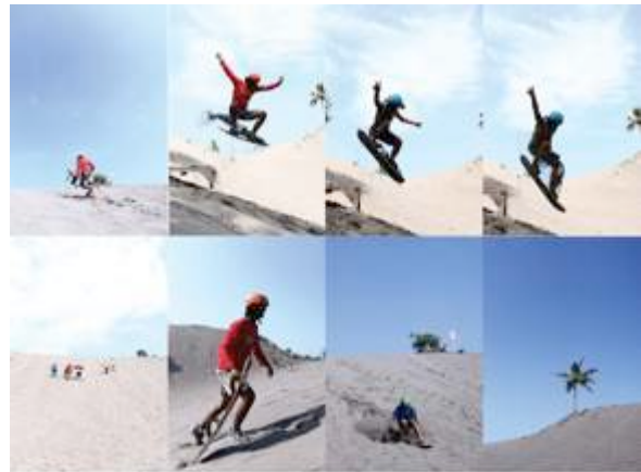
Gambar 6. Final fotografi portrait