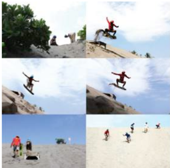
Gambar 5. Final fotografi landscape