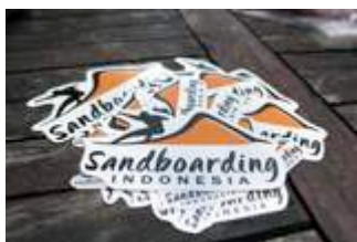
Gambar 16. Final look merchandise sticker