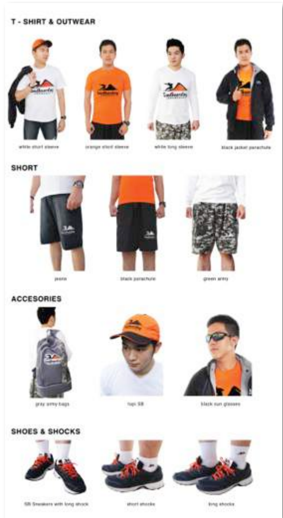
Gambar 17. Final look Desain Merchandise (3 model t-shirt, jacket, 3 model celana pendek, tas ransel, topi, kacamata hitam, sneaker, 2 model kaos kaki panjang dan pendek)