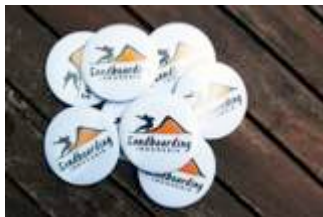
Gambar 15. Final look merchandise pin