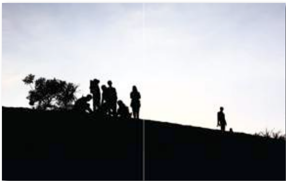
Gambar 18. Buku Profile Sandboarding