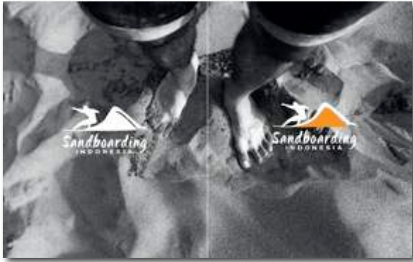
Gambar 19. Buku Profile Sandboarding