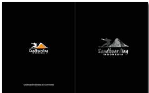
Gambar 18. Buku Profile Sandboarding