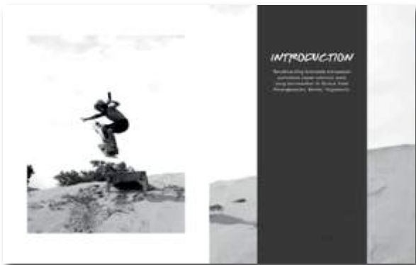
Gambar 18. Buku Profile Sandboarding