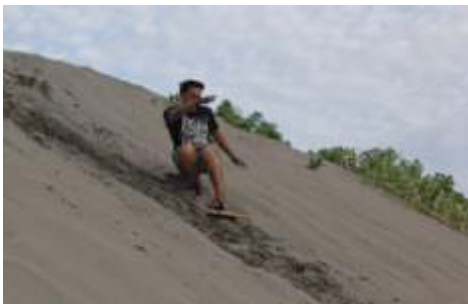
Gambar 3. Pemain Sandboarding