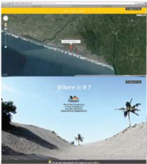
Gambar 14. Final desain website – location ( http://sandboard-indonesia.wix.com/location )