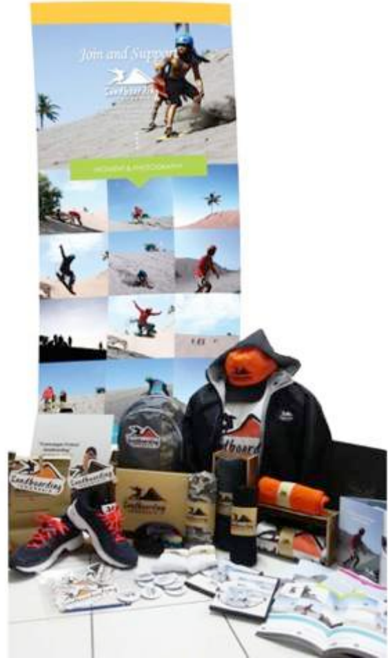
Gambar 19. Final media (merchandise, brosur sandboarding, brosur pameran, poster diri, x-banner, CD sandboarding, buku konsep, buku profile sandboarding)