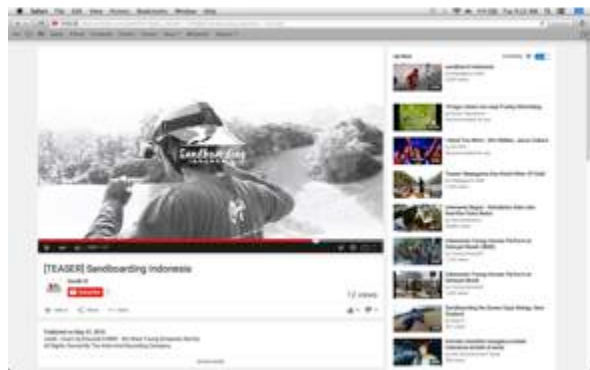
Gambar 7. Final video (TEASER)