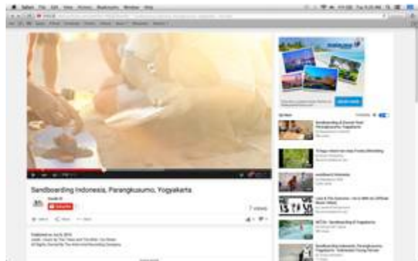
Gambar 8. Final video 2 (Film Sandboarding Indonesia)