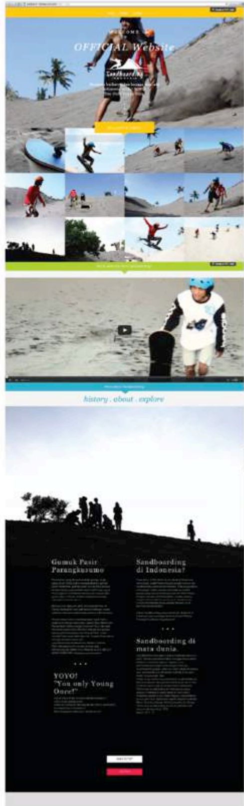
Gambar 14. Final desain website – home ( http://sandboard-indonesia.wix.com/webs )