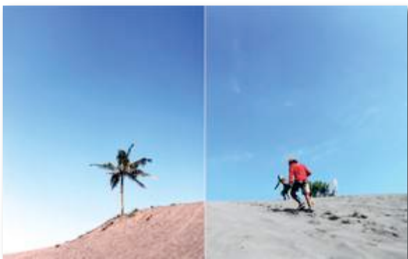
Gambar 18. Buku Profile Sandboarding