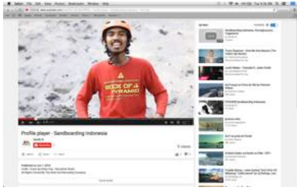
Gambar 10. Final video 3 (Profile player - Sandboarding Indonesia)