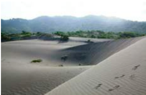
Gambar 2. Lokasi Sandboarding