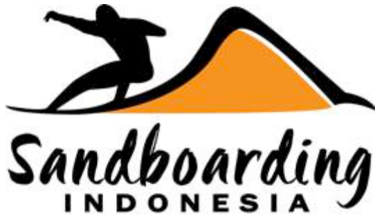
Gambar 4. Final desain logo Sandboarding Indonesia

Perancangan Promosi Sandboarding merupakan sebuah media promosi untuk memperkernalkan olahraga sekaligus permainan papan seluncur pasir sandboarding di Indonesia. Beberapa media yang sangat mendominasi dari ide perancangan ini yaitu logo, videografi, fotografi, media sosial dan merchandise .