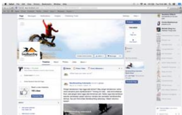
Gambar 13. Final look Media sosial Facebook Page ( https://www.facebook.com/pages/Sandboarding-Indonesia/1585570248363220 )