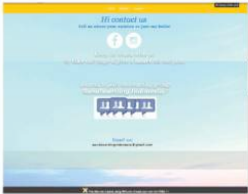
Gambar 14. Final desain website – contact ( http://sandboard-indonesia.wix.com/contact )