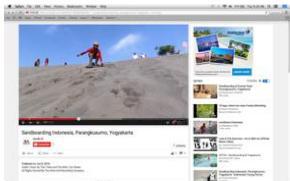
Gambar 9. Final video 2 (Film Sandboarding Indonesia)