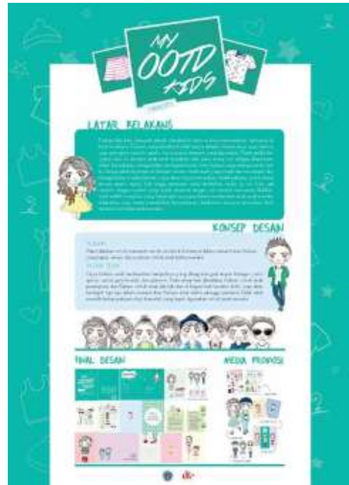
Gambar 51. Poster konsep