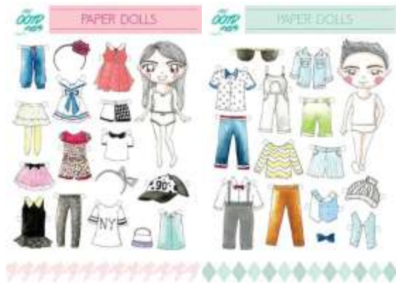
Gambar 45. Paper dolls