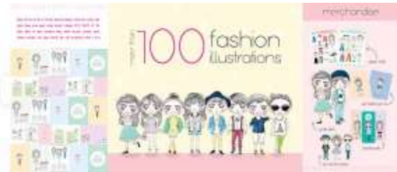
Gambar 54. Katalog tampak belakang