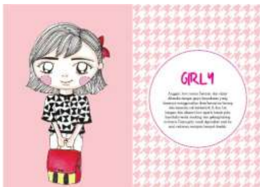
Gambar 20. Halaman 22-23