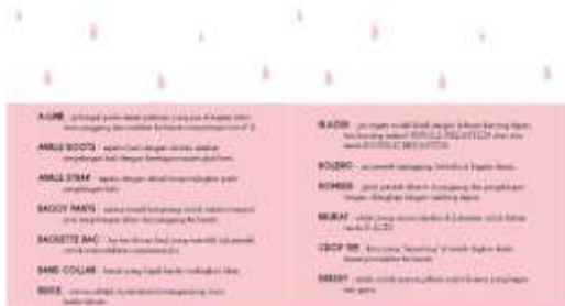
Gambar 38. Halaman 58-59