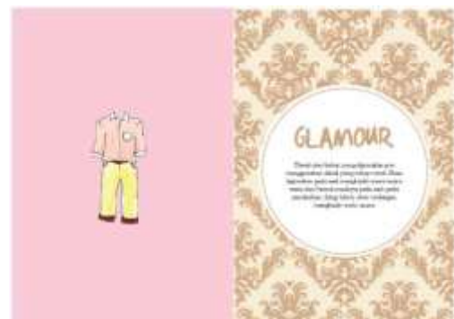
Gambar 26. Halaman 34-35