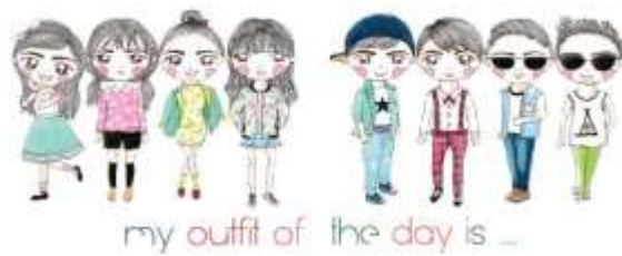
Gambar 44. Halaman 70-71