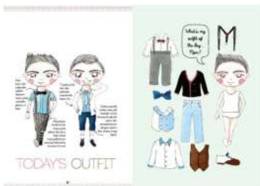
Gambar 30. Halaman 42-43