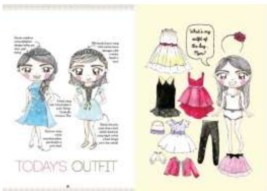
Gambar 28. Halaman 38-39