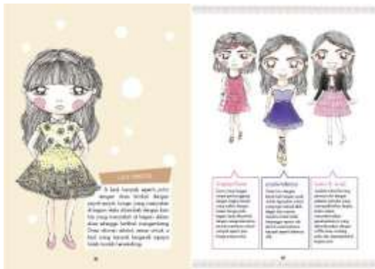
Gambar 27. Halaman 36-37