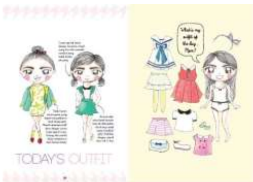
Gambar 22. Halaman 26-27