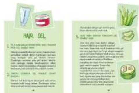
Gambar 32. Halaman 46-47