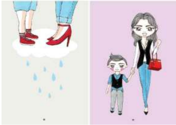
Gambar 43. Halaman 68-69