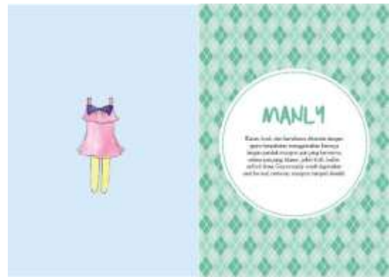
Gambar 23. Halaman 28-29