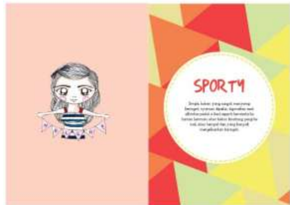
Gambar 10. Halaman 2-3