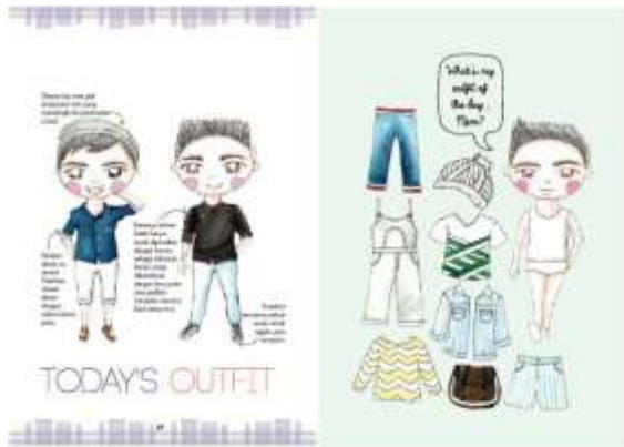
Gambar 19. Halaman 20-21