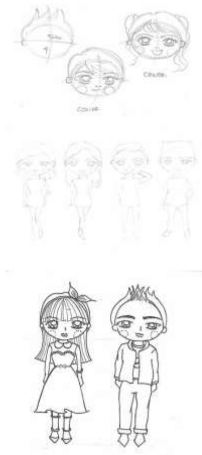
Gambar 1. Thumbnail ilustrasi anak

Berikut ini adalah beberapa thumbnail dan tight tissue dari ilustrasi fashion anak yang diaplikasikan pada buku ini.