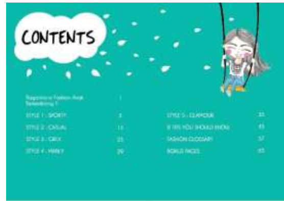
Gambar 8. Daftar isi