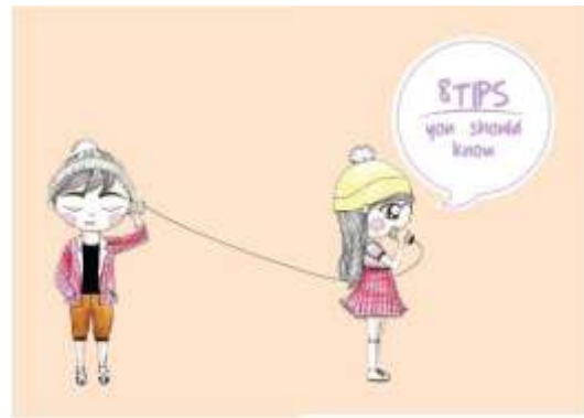
Gambar 31. Halaman 44-45