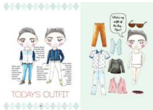
Gambar 25. Halaman 32-33