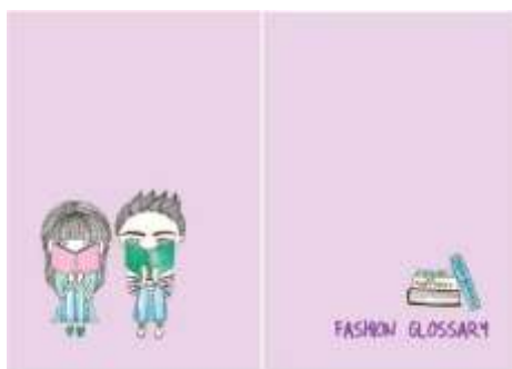
Gambar 37. Halaman 56-57