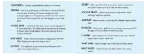
Gambar 39. Halaman 60-61