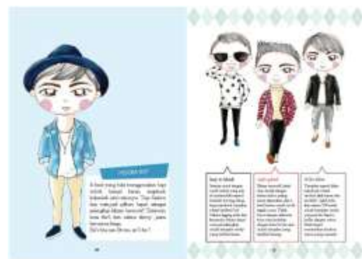
Gambar 24. Halaman 30-31