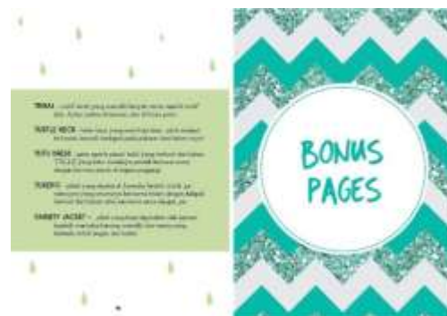
Gambar 41. Halaman 64-65