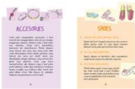
Gambar 35. Halaman 52-53