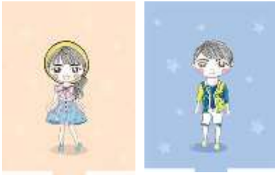
Gambar 49. Cermin