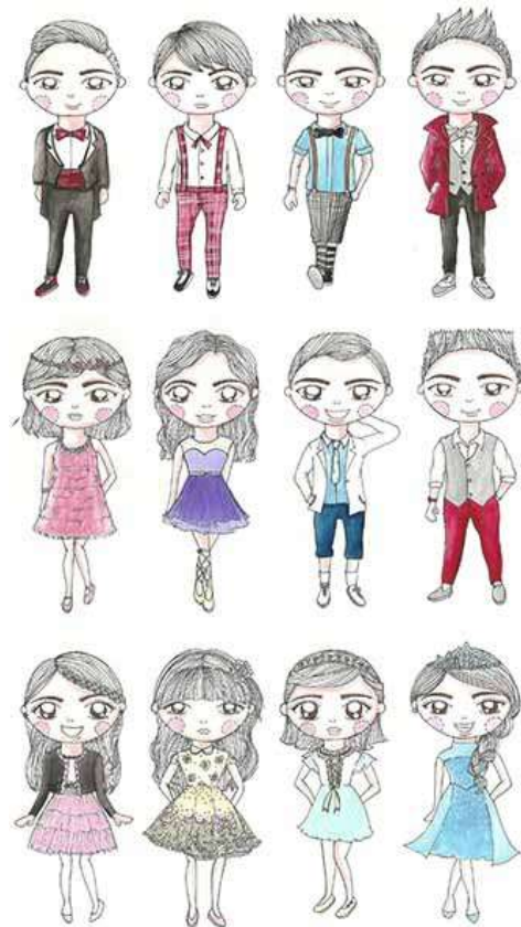
Gambar 3. Final ilustrasi anak