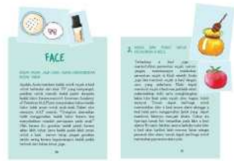
Gambar 34. Halaman 50-51