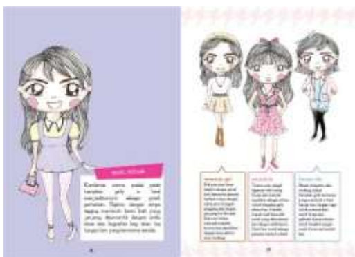
Gambar 21. Halaman 24-25