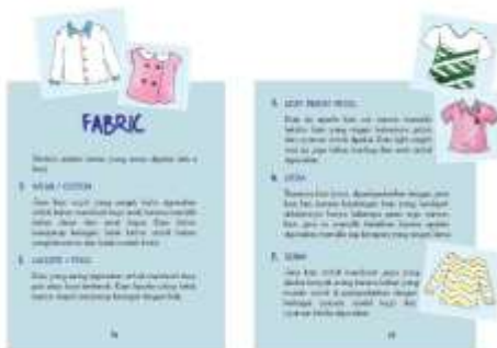
Gambar 36. Halaman 54-55