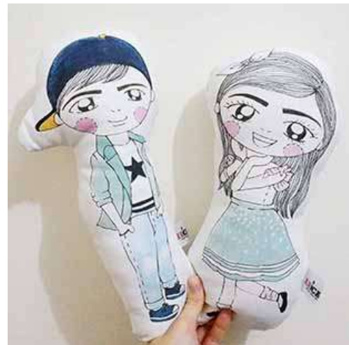
Gambar 47. Boneka