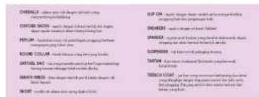
Gambar 40. Halaman 62-63