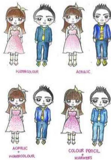
Gambar 2. Tight tissue ilustrasi anak