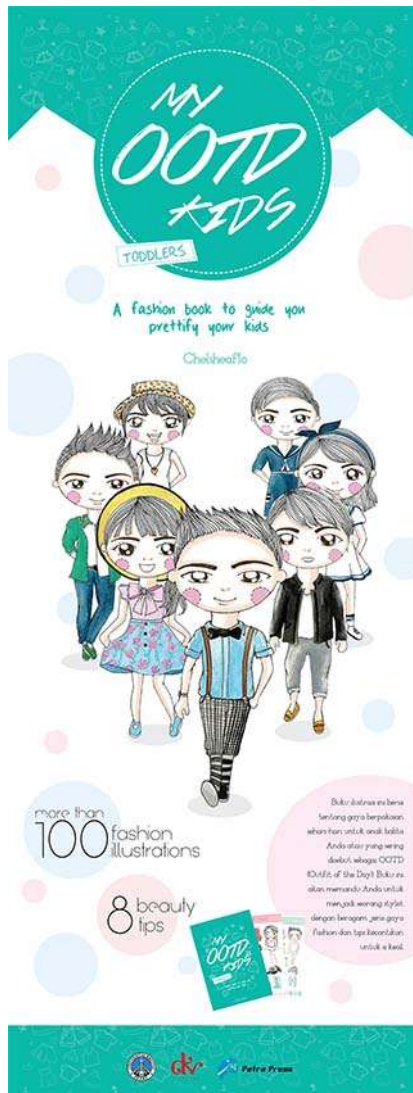
Gambar 50. X-banner