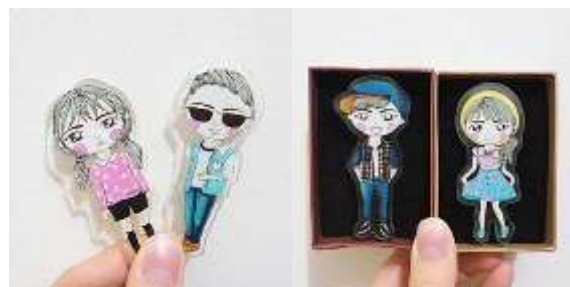
Gambar 48. Bros Akrilik