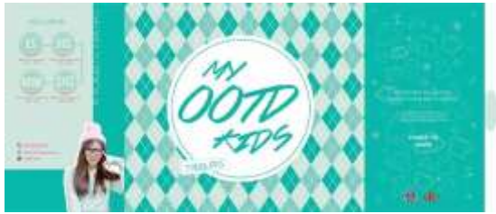
Gambar 53. Katalog tampak depan