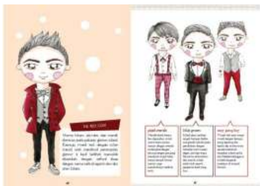
Gambar 29. Halaman 40-41