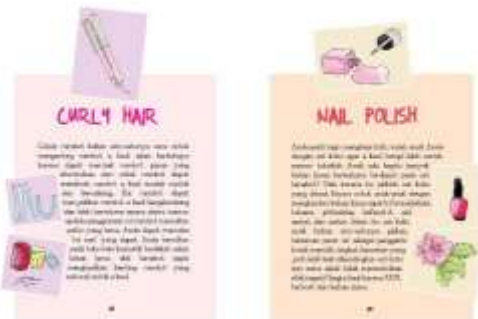
Gambar 33. Halaman 48-49