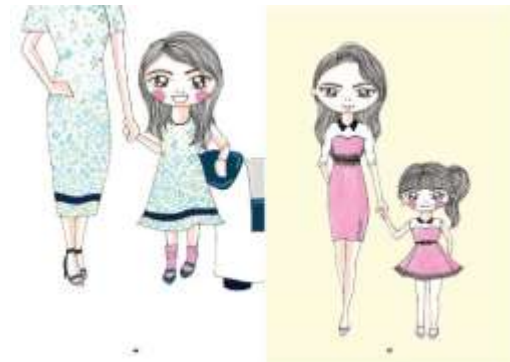
Gambar 42. Halaman 66-67