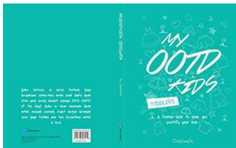
Gambar 6. Cover dalam