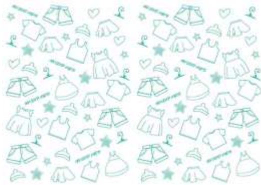
Gambar 4. Cover buku