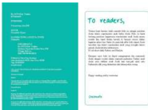
Gambar 7. Halaman penulis