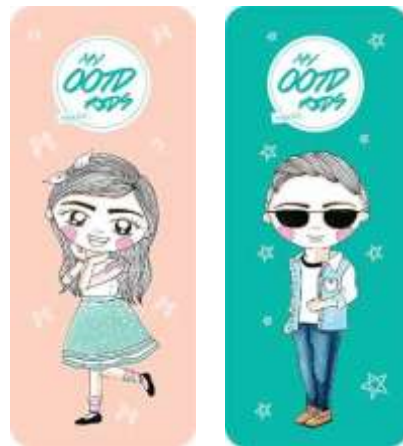
Gambar 46. Pembatas buku