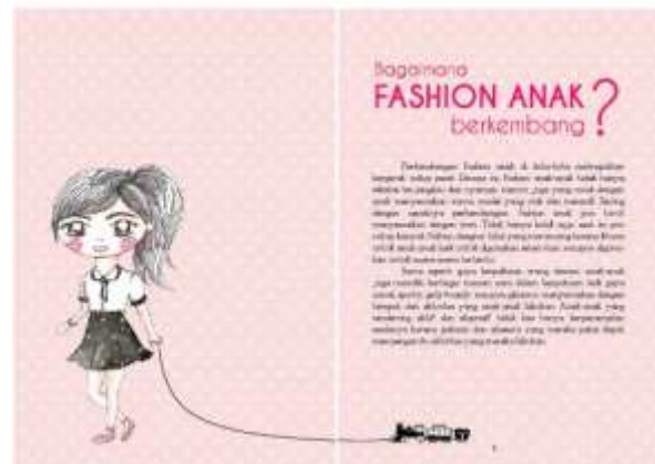
Gambar 9. Halaman 1