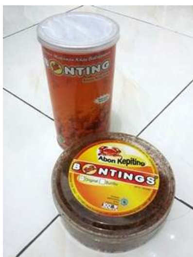
Gambar 5. Produk Abon Kepiting Bontings dalam kemasan toples (100 gram) dan kaleng (200 gram)