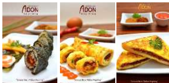
Gambar 13. Saran penyajian abon kepiting Bontings

bervariasi, diharapkan selera calon konsumen untuk mengkonsumsi abon kepiting Bontings akan bertambah besar. Nama ketiga media sosial ini adalah abonbontings.