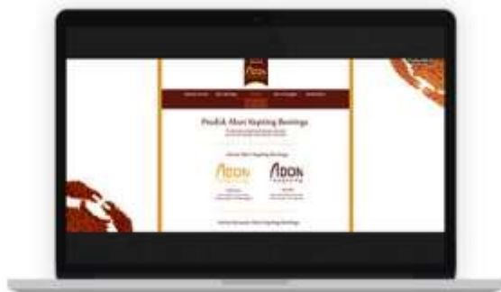
Gambar 17. Tampilan website halaman produk