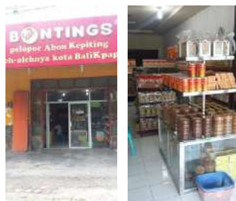
Gambar 3. Salah satu outlet Bontings di Kota Balikpapan

Terbukti saat ini produk-produk olahannya telah didistribusikan ke lebih dari 100 toko, dengan 86 toko di Kota Balikpapan. Saat ini, Bontings telah memiliki gerainya sendiri, yaitu sebanyak dua buah di Kota Balikpapan dan satu di Kota Palangkaraya.