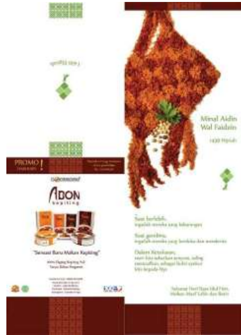
Gambar 23. Tampilan brosur abon keping Bontings edisi hari raya Idul Fitri