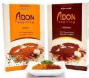
Gambar 10. Kemasan kotak Abon Kepiting Bontings (50 gram)

foto abon masing-masing varian yang dibentuk menjadi kepiting.