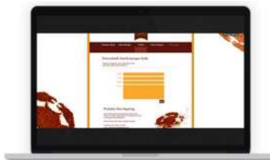
Gambar 19. Tampilan website halaman kontak