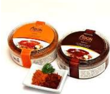
Gambar 11. Kemasan toples Abon Kepiting Bontings (100 gram)