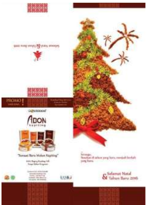
Gambar 22. Tampilan brosur abon keping Bontings edisi hari raya Natal dan tahun baru