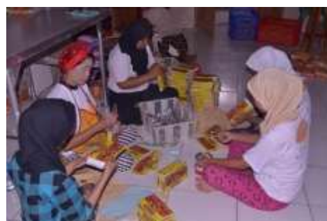
Gambar 2. Proses Pengemasan Abon Kepiting Bontings

Terbukti saat ini produk-produk olahannya telah didistribusikan ke lebih dari 100 toko, dengan 86 toko di Kota Balikpapan. Saat ini, Bontings telah memiliki gerainya sendiri, yaitu sebanyak dua buah di Kota Balikpapan dan satu di Kota Palangkaraya.