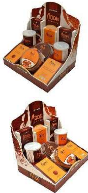
Gambar 24. POP table display

POP dalam perancangan ini mencakup display dari produk abon keping Bontings pada tempat yang menjualnya secara langsung. POP digunakan agar produk abon keping Bonting lebih menarik dan lebih terlihat jika diletakkan pada sebuah tempat penjualan.