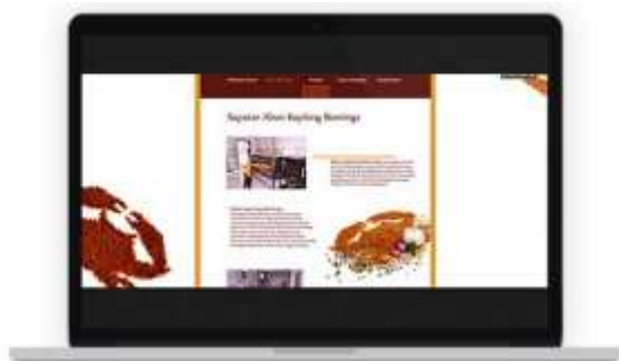
Gambar 16. Tampilan website halaman seputar abon keping Bontings