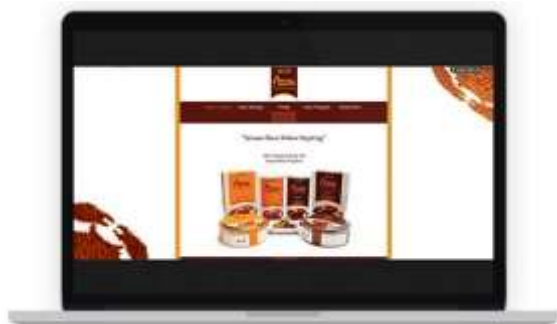
Gambar 15. Tampilan website halaman utama

Website abon keping Bontings terdiri dari lima halaman, yaitu halaman utama, halaman seputar abon keping Bontings, halaman produk, halaman saran penyajian dan halaman kontak. Halaman utama berisi tampilan seluruh produk Abon Keping Bontings. Halaman seputar Abon Keping Bontings berisi sejarah, proses pembuatan dan keunggulan. Halaman produk berisi rincian produk Abon Keping Bontings, mulai dari varian, harga dan ukuran. Halaman saran penyajian berisi saran penyajian yang menarik bagi konsumen dalam mengonsumsi Abon Keping Bontings. Dan halaman kontak berisi kolom saran, alamat produksi, alamat tempat Abon Keping Bontings dijual dan kontak lengkap Bontings.