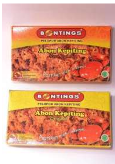
Gambar 4. Produk Abon Kepiting Bontings dalam kemasan kotak (50 gram)

Kemasan Abon Kepiting Bontings dibagi menjadi tiga macam. Yaitu kemasan kotak dengan isi 50 gram, kemasan toples dengan isi 100 gram, dan kemasan kaleng dengan isi 200 gram.