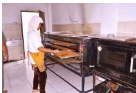
Gambar 1. Proses Produksi Abon Kepiting Bontings

bahan dasar abon olahannya. Dengan banyak mencoba, mengulang dan memperbaiki kualitas abonnya, Abon Kepiting Bontings akhirnya dapat memenangkan Kontes Panganan Khas Kota Balikpapan pada tahun 2006. Karenanya, Abon Kepiting Bontings banyak diliput oleh media massa daerah maupun nasional hingga semakin banyak diketahui oleh banyak orang. Sejak saat itu, Abon Kepiting Bontings beserta inovasi pangan lainnya dari CV.Dzakwanifood ini terus berkembang dan meluas terutama di pulau Kalimantan.