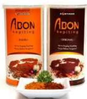
Gambar 12. Kemasan kaleng Abon Kepiting Bontings (100 gram)