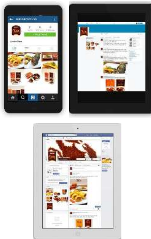
Gambar 14. Tampilan media sosial abon kepiting Bontings