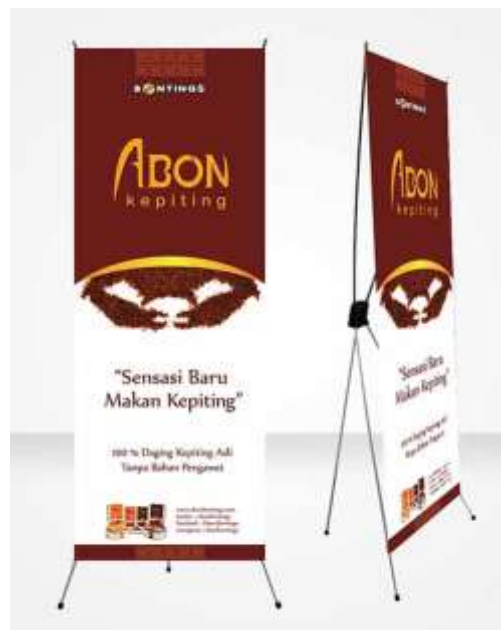
Gambar 26. X-Banner abon keping Bontings

X-banner dengan ukuran 160 cm x 60 cm digunakan sebagai media pendukung untuk menambah daya tarik akan produk bagi target audience sehingga lebih terlihat. Media ini terutama digunakan pada tempat yang menjual produk secara langsung.