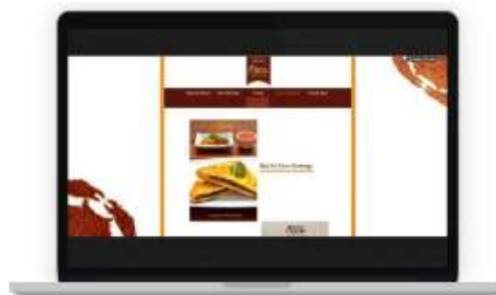
Gambar 18. Tampilan website halaman saran penyajian abon keping Bontings