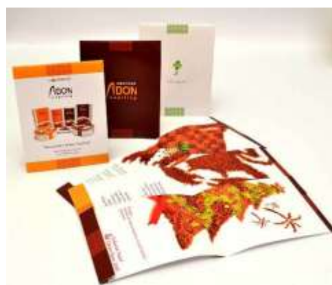
Gambar 20. Tampilan bentuk brosur abon keping Bontings

Brosur digunakan sebagai media yang menggiring target audience untuk melihat informasi awal dan kemudian lebih lanjut akan abon keping Bontings di media sosial dan website . Brosur dibagikan pada tempat-tempat pusat jajanan dan tempat-tempat didekat produk dijual secara langsung. Brosur yang disebar juga memiliki versi pada saat hari raya besar di Indonesia, yaitu hari raya Idul Fitri dan hari raya Natal juga tahun baru dalam bentuk kartu ucapan. Ini ditujukan untuk lebih mendekatkan abon keping Bontings dengan target audience .