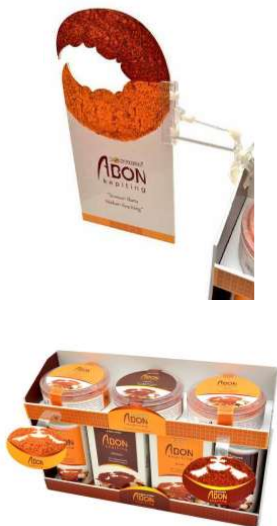
Gambar 25. POP shelf display

POP ini digunakan untuk menarik perhatian target audience jika produk abon keping diletakan di rak yang menjual berbagai macam produk seperti rak di Supermarket. Terdapat tiga macam shelf display abon keping Bontings, yaitu label rak, shelf display yang ditempel dengan mika di rak, dan shelf display bendera yang menggantung tegak lurus dengan rak.