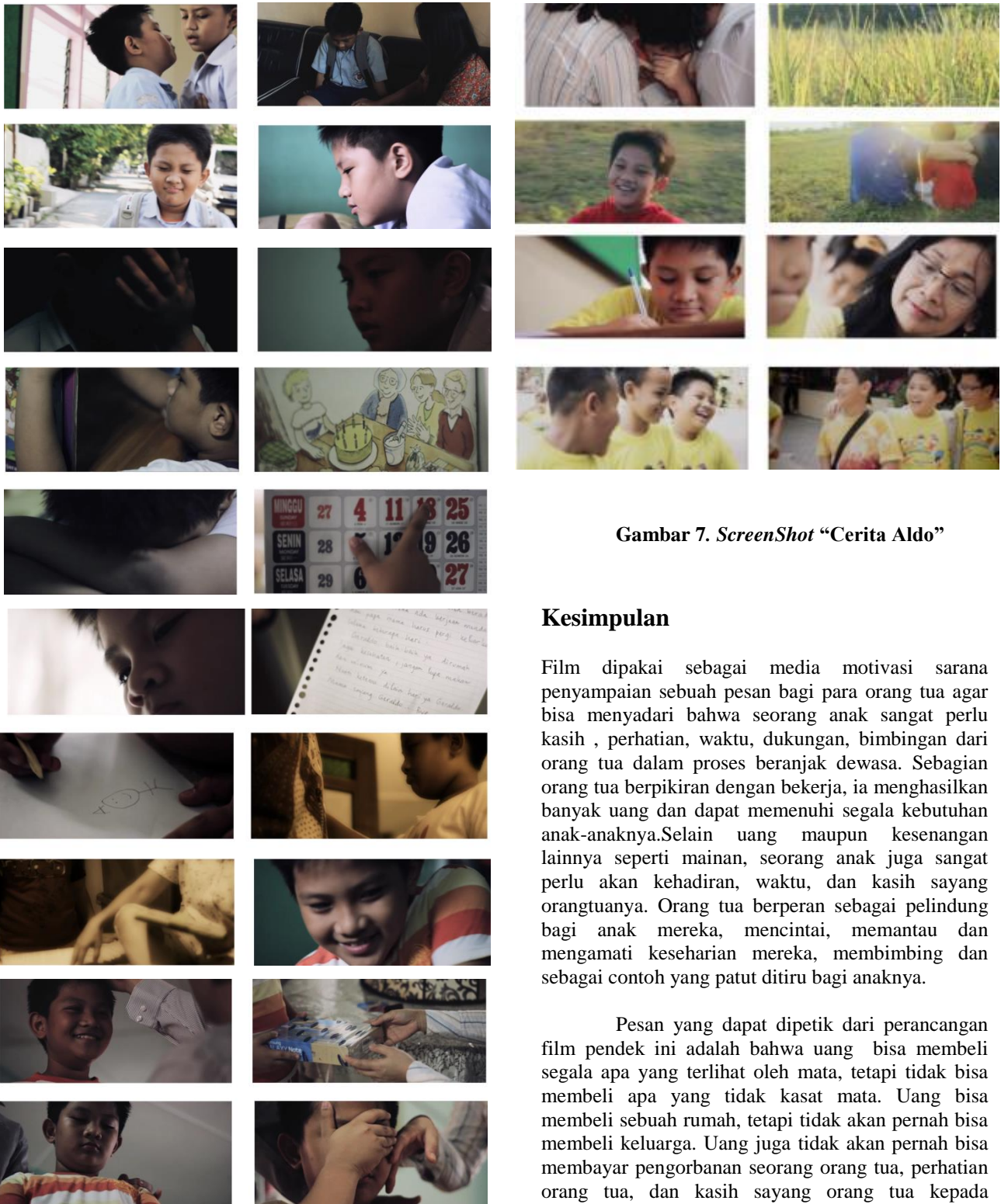
Gambar 6. ScreenShot “Cerita Aldo”