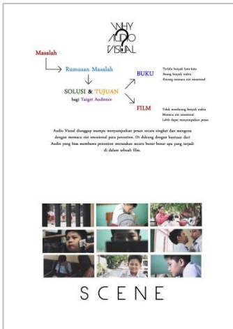
Gambar 4. Katalog film “Cerita Aldo”