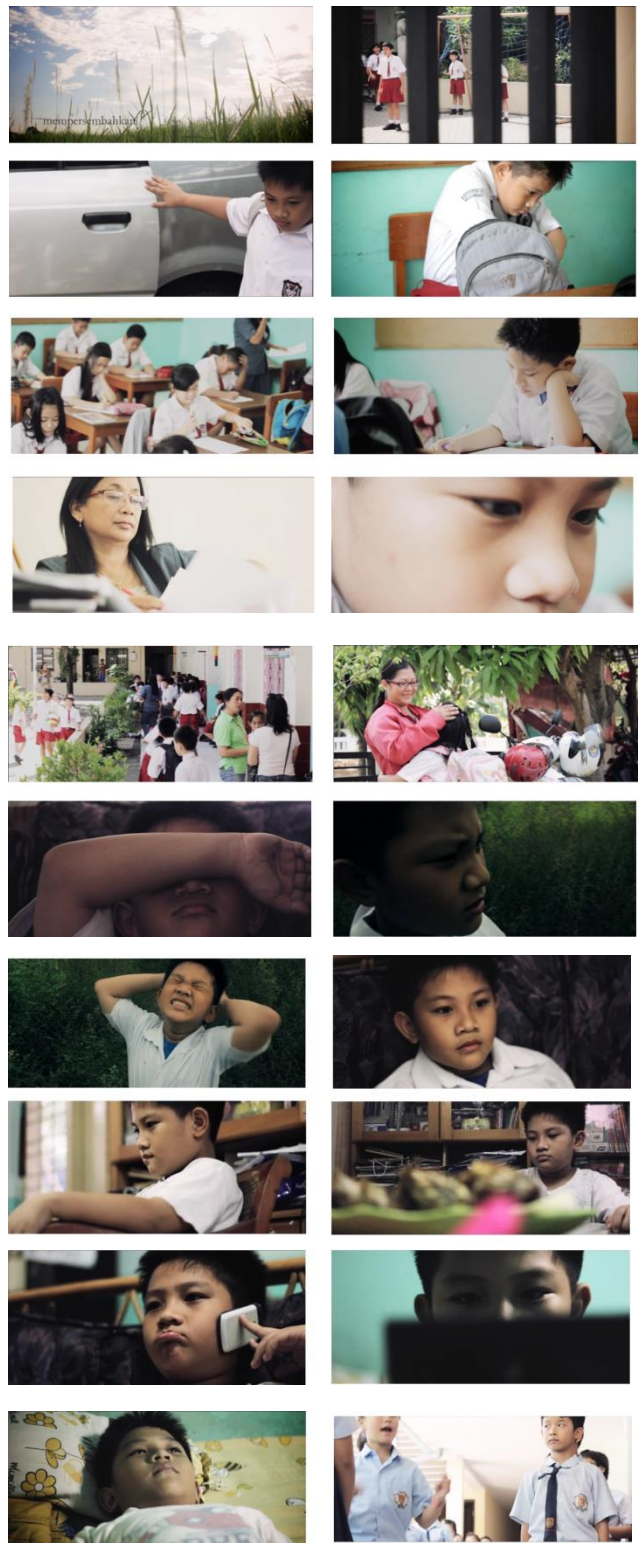
Gambar 5. ScreenShot “Cerita Aldo”