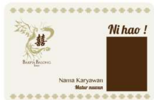
Gambar 8. ID Card