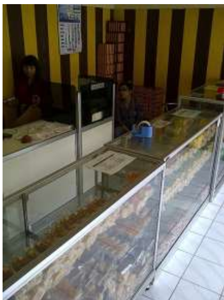
Gambar 2. Bagian Dalam Toko Bakpia Balong

Kue pia ini mempunyai ciri khas tersendiri yaitu bentuknya yang lebih besar dan beraneka macam isi daripada bakpia pada umumnya. Berbagai macam isi yang ada antara lain isi coklat, kacang hijau, kumbu hitam dan babi. Untuk mengikuti perkembangan zaman pemilik berinovasi mengembangkan usahanya dengan menambahkan isi pia dengan isi keju dan isi keju coklat. Sehingga Bakpia Balong dapat dipilih sesuai selera dengan 6 macam variasi isi.