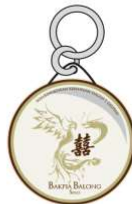
Gambar 9. Gantungan Kunci