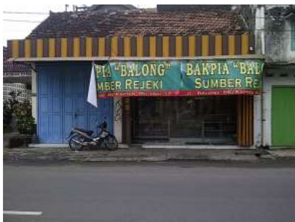
Gambar 1. Lokasi Bakpia Balong