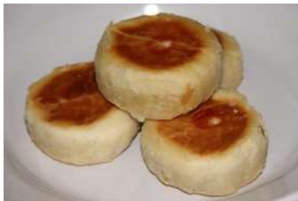
Gambar 3. Bakpia dari Bakpia Balong

Kue pia ini mempunyai ciri khas tersendiri yaitu bentuknya yang lebih besar dan beraneka macam isi daripada bakpia pada umumnya. Berbagai macam isi yang ada antara lain isi coklat, kacang hijau, kumbu hitam dan babi. Untuk mengikuti perkembangan zaman pemilik berinovasi mengembangkan usahanya dengan menambahkan isi pia dengan isi keju dan isi keju coklat. Sehingga Bakpia Balong dapat dipilih sesuai selera dengan 6 macam variasi isi.