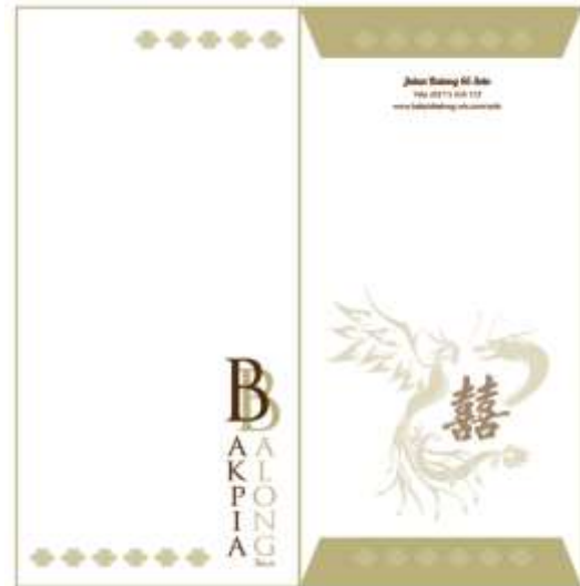
Gambar 7. Amplop

Stationary dibuat untuk menunjukkan identitas Bakpia Balong di dalam aktifitas yang berhubungan dengan kepentingan perusahaan sehari-hari. Stationary yang dibuat adalah amplop, kop surat, stempel dan kartu nama.