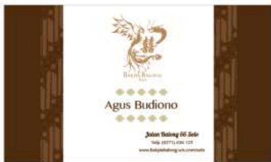
Gambar 10. Kartu Nama