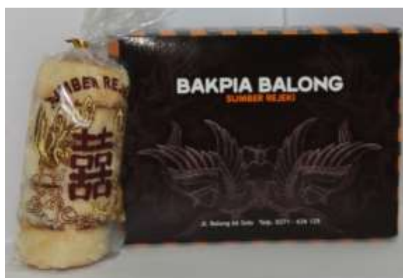
Gambar 5. Kemasan Plastik dan Kotak Bakpia Balong

Bakpia Balong dikemas dengan kantong plastik yang berisikan 5 biji pia. Kantong plastik disablon dengan perpaduan 2 warna yang mengikuti warna isi. Selain itu kantong plastik disablon dengan huruf mandarin bertuliskan “shuang xi” atau berarti double happiness . Masyarakat Tionghoa dahulu percaya bahwa double happiness yang dilambangkan dengan naga dan burung hong mempunyai arti sebagai aibol yang membawa kebahagiaan dan keberuntungan dalam keluarga.