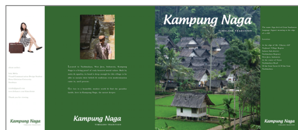
Gambar 5. Layout cover buku fotografi