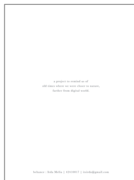
Gambar 7. Layout cover depan & belakang