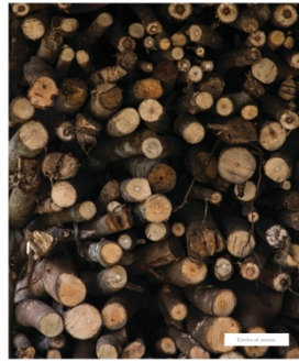
Gambar 6. Layout buku fotografi halaman 63-64