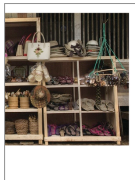
Gambar 8. Layout katalog halaman 5-6