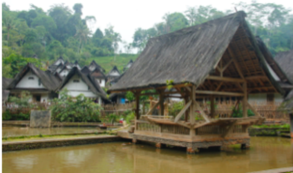
Gambar 2. Kampung Naga Dalam

Kampung Naga memiliki 2 bagian, yaitu Kampung Naga Dalam dan Kampung Naga Luar. Kampung Naga Dalam adalah bagian dari Kampung Naga yang masih sangat kuat menjaga tradisi leluhurnya dan merupakan objek dari perancangan ini. Sedangkan Kampung Naga Luar terletak lebih dekat ke jalan raya dan kehidupannya sudah jauh berbeda dengan Kampung Naga Dalam.