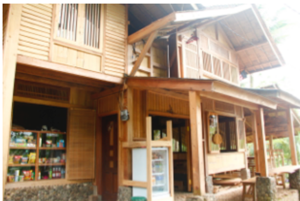
Gambar 3. Warung di Kampung Naga Luar

Wilayah Kampung Naga bagian luar berbeda kondisinya dengan bagian dalam. Meskipun hanya terpisah sejauh 439 anak tangga dengan jarak sekitar 500 meter saja, peradaban di Kampung Naga Luar jauh lebih modern. Konstruksi rumah di Kampung Naga Luar menggunakan tembok batu-bata sebagai dindingnya, fondasi tidak berbentuk panggung namun layaknya rumah-rumah di pedesaan yang modern. Pengecatan di Kampung Naga Luar diperbolehkan sehingga rumah-rumah disana berwarna-warni, atapnya juga tidak menggunakan ijuk melainkan genting, dan ukuran rumahnya boleh berbeda-beda. Kondisi warung disini juga berbeda jauh dengan di bagian dalam. Terdapat kulkas dan vending machine yang berisi berbagai macam minuman dingin, serta variasi produknya lebih banyak. Ukuran warung juga lebih besar dan lebih terbuka dibandingkan di bagian dalam. Terdapat juga rumah makan dengan arsitektur tradisional yang bahannya dari kayu, dan terdiri dari 2 lantai.