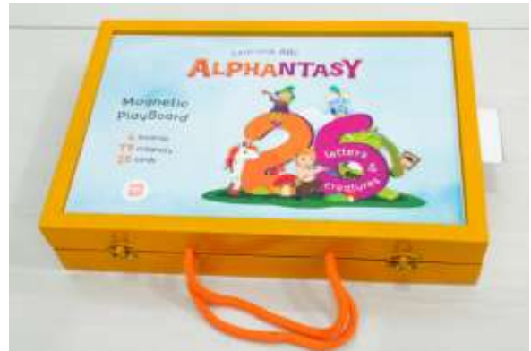
Gambar 8. Desain Media Interaktif Papan Magnet