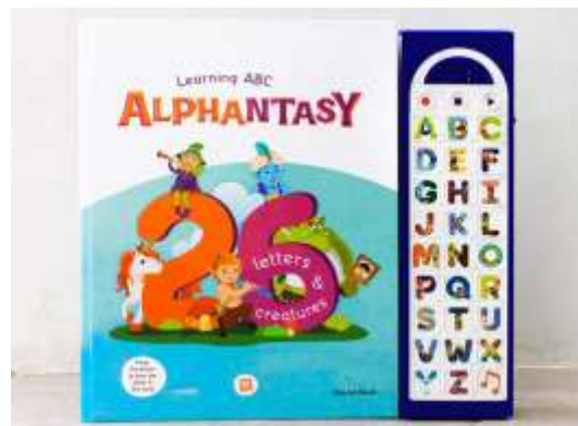
Gambar 1. Media interaktif buku suara