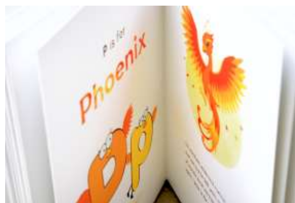
Gambar 3. Layout buku (2)