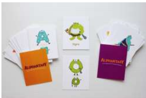
Gambar 7. Desain Kartu Match-up