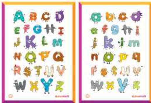
Gambar 6. Desain Poster ABC