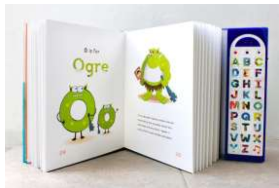
Gambar 2. Layout buku (1)