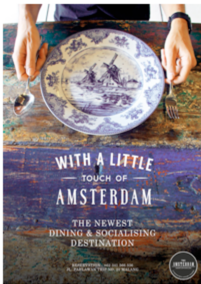
Gambar 8. Desain Final Poster