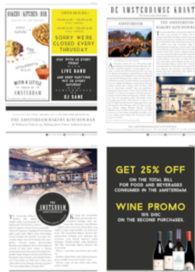
Gambar 4. Desain Final Brosur