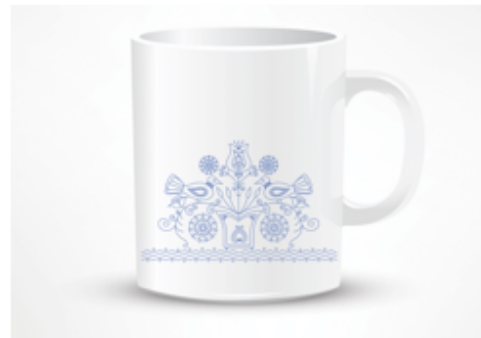
Gambar 10. Desain Final Merchandise Mug