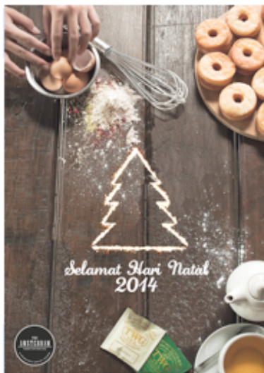
Gambar 1. Desain Final Iklan Koran