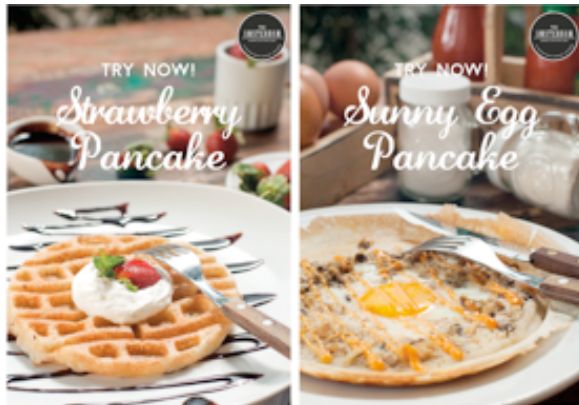
Gambar 7. Desain Final Neon Box