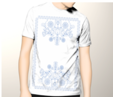
Gambar 9. Desain Final Merchandise T-Shirt