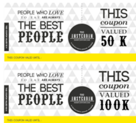
Gambar 11. Desain Final Voucher

Media flyer , brosur, x-banner , neon box , poster, spanduk, merchandise dan voucher merupakan media-media Below The Line (BTL). Media BTL adalah segala aktivitas marketing atau promosi yang dilakukan di tingkat retail atau konsumen dengan salah satu tujuannya adalah merangkul konsumen supaya tahu tentang keberadaan produk yang dipromosikan, seperti misalnya program bonus atau hadiah, event , pembinaan konsumen dan lain sebagainya. Pada intinya aktivitas BTL selalu bertujuan untuk mendukung dan melanjutkan aktivitas ATL. Sifat BTL merupakan media yang langsung mengenai audience karena sifatnya yang memudahkan audience langsung menyerap satu produk atau pesan saja.