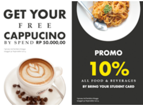
Gambar 3. Desain Final Flyer

Media iklan koran dan iklan majalah ini merupakan media ATL ( Above The Line ). Jenis media ini biasanya dilakukan oleh manajemen pusat sebagai upaya membentuk brand image yang diinginkan, contohnya seperti iklan di televisi dengan berbagai versi. Sifat ATL merupakan media tidak langsung yang mengenai audience , karena sifatnya yang terbatas pada penerimaan audience .