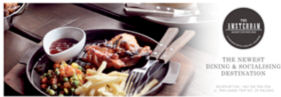
Gambar 6. Desain Final Spanduk