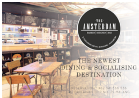
Gambar 2. Desain Final Iklan Majalah

Media iklan koran dan iklan majalah ini merupakan media ATL ( Above The Line ). Jenis media ini biasanya dilakukan oleh manajemen pusat sebagai upaya membentuk brand image yang diinginkan, contohnya seperti iklan di televisi dengan berbagai versi. Sifat ATL merupakan media tidak langsung yang mengenai audience , karena sifatnya yang terbatas pada penerimaan audience .