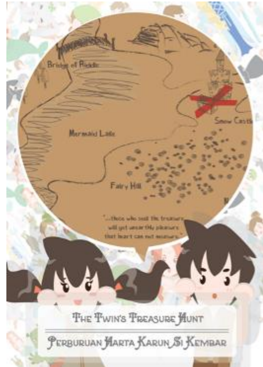
Gambar 9. Katalog Promosi (Depan)

Media promosi yang dibuat dalam perancangan kali ini berupa poster promosi untuk pameran beserta katalog.