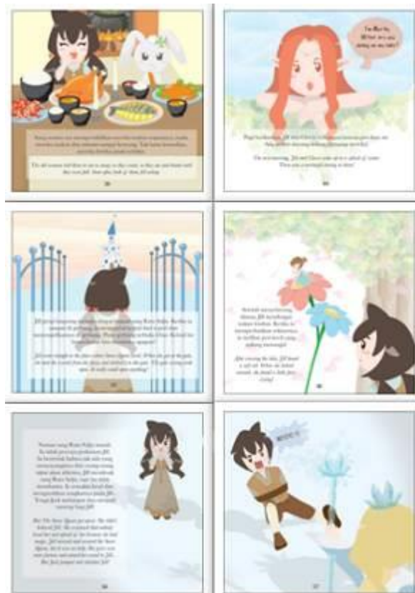
Gambar 6. Isi Buku Cerita

Setelah selesai membuat cover, dimulailah proses pembuatan isi buku cerita bergambar. Tiap-tiap kejadian dalam cerita divisualisasikan dengan gambar yang mewakili keseluruhan peristiwa tersebut. Kemudian, ditambahkan dialog pada gambar.