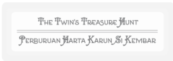
Gambar 3. Penerapan Font dalam Judul

Setelah itu, ditentukanlah layout , tone warna, serta tipografi yang akan digunakan, juga desain cover depan dan belakang.