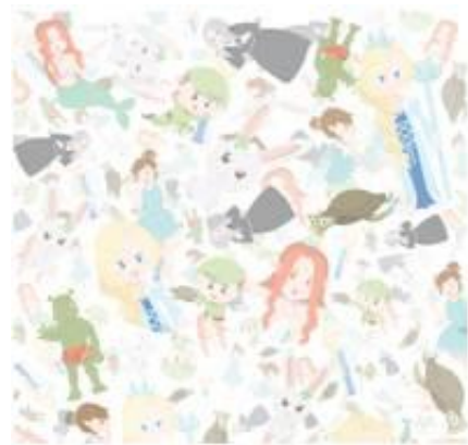
Gambar 5. Cover Belakang

Setelah selesai membuat cover, dimulailah proses pembuatan isi buku cerita bergambar. Tiap-tiap kejadian dalam cerita divisualisasikan dengan gambar yang mewakili keseluruhan peristiwa tersebut. Kemudian, ditambahkan dialog pada gambar.