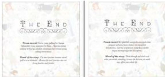
Gambar 8. Halaman Penutup dengan Pesan Moral

Tidak hanya buku cerita bergambar, perancangan ini dilengkapi juga dengan berbagai media pendukung baik media promosi maupun media souvenir atau disebut juga merchandise . Media-media pendukung ini dibuat guna mendukung efektifitas promosi serta memperkuat penyampaian informasi untuk tercapainya tujuan dari perancangan buku cerita fiktif bergambar dwibahasa tersebut sebagai sarana hiburan yang edukatif.