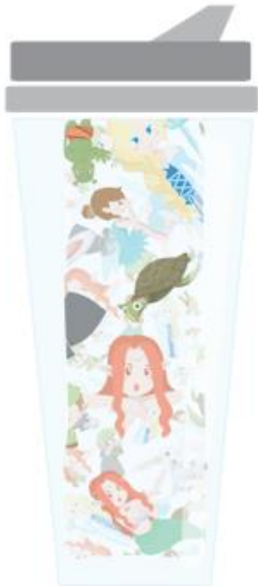
Gambar 16. Botol Minum