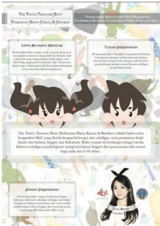
Gambar 11. Poster Pameran

Media souvenir atau merchandise yang dibuat berupa pernak-pernik atau benda-benda yang sering digunakan dalam kegiatan sehari-hari dari target audience . Melalui barang-barang tersebut, target audience dapat mengenal lebih dekat tokoh-tokoh favorit mereka dalam perancangan ini. Media souvenir atau merchandise yang dibuat diantaranya adalah pin, pembatas buku, stiker, gantungan kunci, dan botol minum.