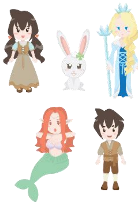
Gambar 14. Stiker