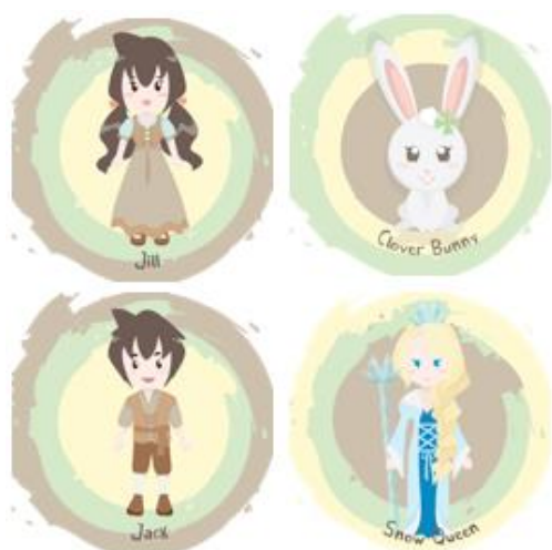
Gambar 12. Pin

Media souvenir atau merchandise yang dibuat berupa pernak-pernik atau benda-benda yang sering digunakan dalam kegiatan sehari-hari dari target audience . Melalui barang-barang tersebut, target audience dapat mengenal lebih dekat tokoh-tokoh favorit mereka dalam perancangan ini. Media souvenir atau merchandise yang dibuat diantaranya adalah pin, pembatas buku, stiker, gantungan kunci, dan botol minum.