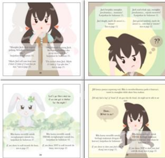
Gambar 7. Halaman Cerita dengan Pilihan