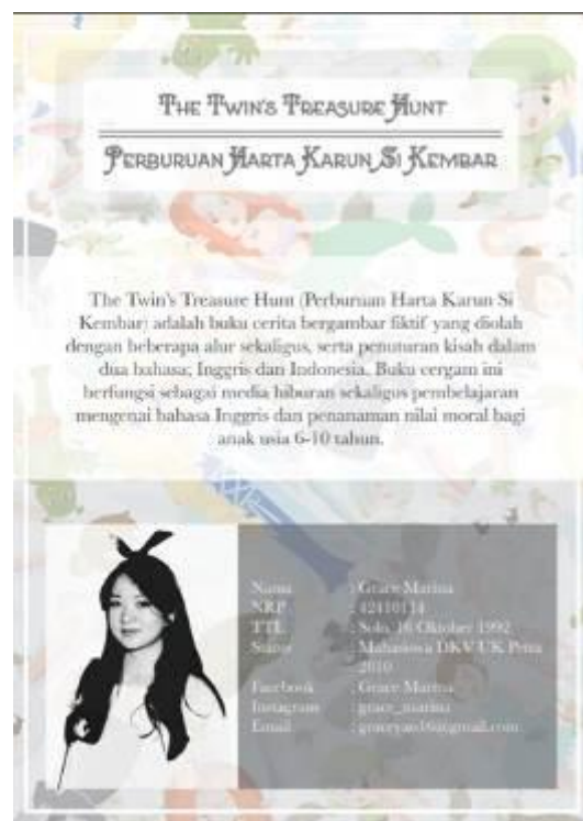
Gambar 10. Katalog Promosi (Belakang)