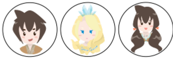
Gambar 15. Gantungan Kunci