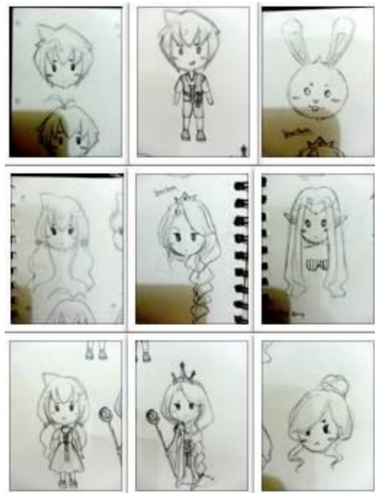
Gambar 1. Sketsa Tokoh

Pemilihan judul buku merupakan salah satu unsur penting dalam pembuatan buku. Judul buku hendaknya dapat menjadi representasi dari kisah yang diceritakan. "The Twin's Treasure Hunt (Perburuan Harta Karun Si Kembar)" dipilih sebagai judul buku karena singkat, mudah dipahami, dan merujuk langsung pada tema cerita. Setelah menentukan judul, dibuatlah sketsa tokoh-tokoh lengkap dengan deskripsi karakternya, lalu dilanjutkan pada alur cerita.