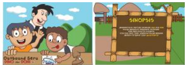
Gambar 2. Desain sampul depan dan belakang

Setelah selesai membuat semua manual sketsa. Sketsa yang terpilih divisualisasikan melalui proses digital sesuai dengan gaya desain yang telah dipilih dan disesuaikan dengan selera target audiens (anak-anak usia 6-11 tahun). Gaya visual ilustrasi yang dipergunakan dalam perancangan ini adalah gaya full colour . Dimana tokoh-tokoh dan latar belakangnya menggunakan warna-warna cerah dan tidak menyisakan white space sama sekali. Seluruh desain menggunakan warna cerah yang disukai anak-anak.