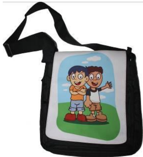
Gambar 7. Desain Tas