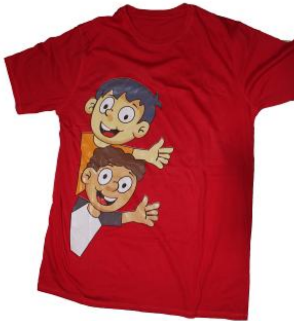
Gambar 8. Desain Baju