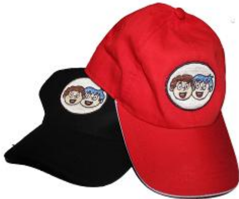
Gambar 5. Desain Tas

Selain itu juga ada topi untuk pelindung dari sinar matahari selama kegiatan outbound berlangsung.