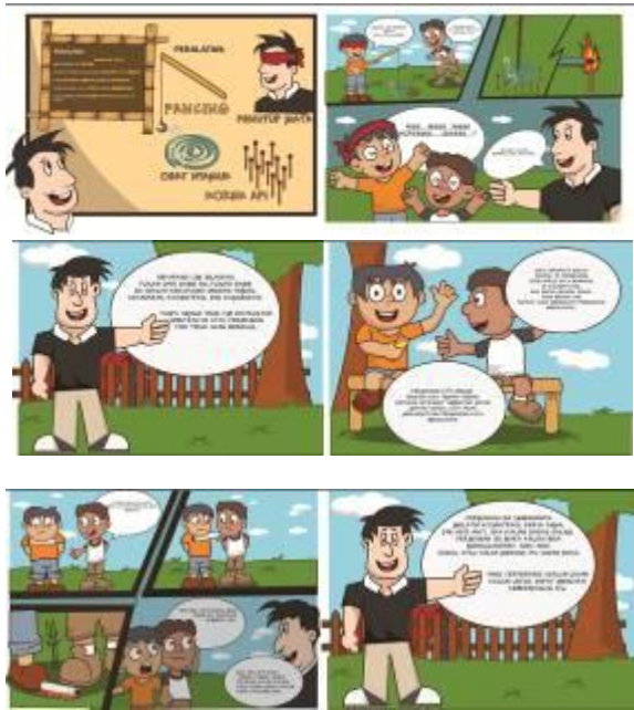
Gambar 4. Desain akhir buku Sumber : Olahan pribadi

Setelah buku cerita bergambar selesai semua dibuatlah media pendukungnya. Media pendukung disini difungsikan untuk mendukung kegiatan outbound. Seperti tas yang difungsikan untuk menjadi packaging sekaligus menjadi wadah untuk media yang lain.