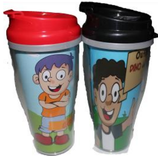
Gambar 6. Desain Tumbler

Selain topi sebagai media pendukung ada juga tumbler sebagai wadah minum untuk menyimpan air selama melakukan kegiatan outbound.