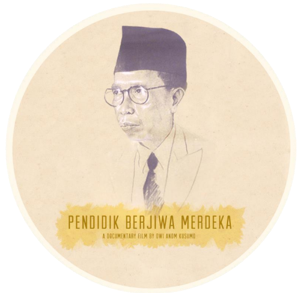
Gambar 12. Label DVD