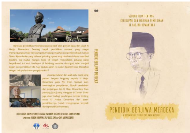
Gambar 10. Cover DVD