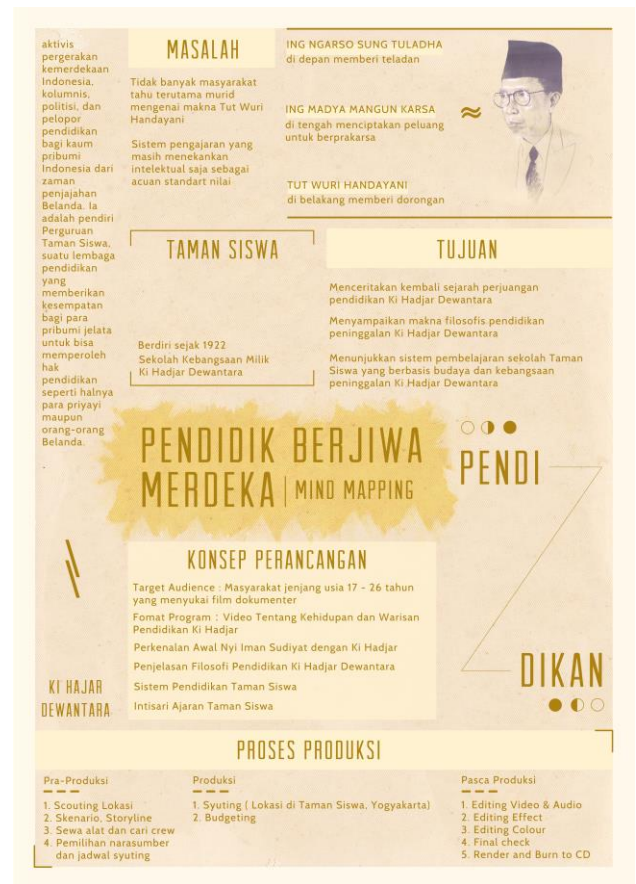
Gambar 13. Poster Mind-Map