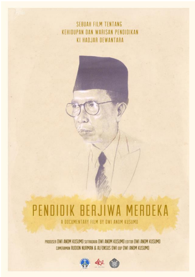
Gambar 11. Poster Film