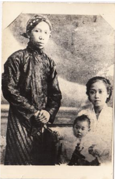
Gambar 6. Foto keluarga Ki Hadjar, Nyi Hadjar dan putri pertamanya Ni Asti. Berfoto di Belanda

Mengetahui Ki Hadjar Dewantara sedang sakit, Ir Soekarno menjenguk Ki Hadjar Dewantara. Terlihat bahwa Ir. Soekarno sangat menghormati beliau dan menyempatkan waktu dari kesibukannya untuk menjenguk beliau.