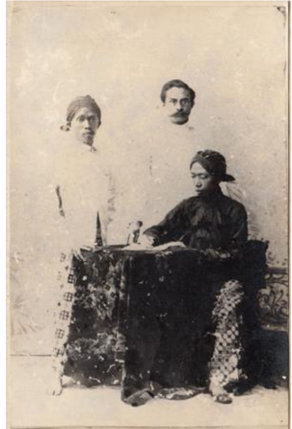
Gambar 4. Tokoh 3 Serangkai, Dr. Cipto Mangunkusumo, Douwes Dekker, Soewardi Soerjaningrat

Foto Ki Hadjar dan Nyi Hadjar yang sedang berpakaian adat Jawa. Terlihat sosok Ki Hadjar yang sangat terlihat santun dan bersahaja