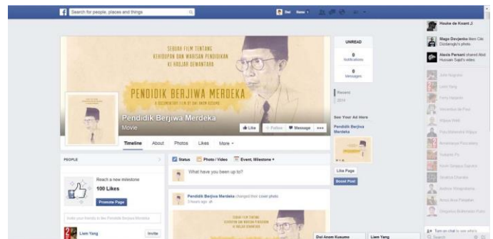
Gambar 9. Penyebaran film melalui social media (Facebook)