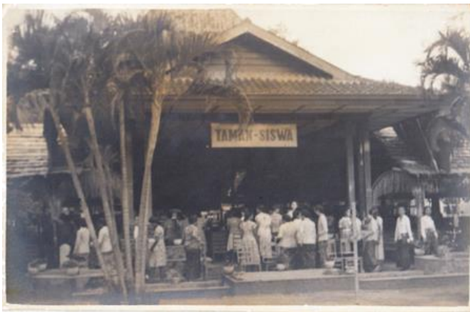
Gambar 3. Kompleks Taman Siswa

Sebelum terjun ke dunia pendidikan, Ki Hadjar adalah seorang yang aktif di dunia politik dan partai pertama yang dibentuk bersama sahabatnya adalah Indische Partij yang terdiri dari tokoh 3 serangkai yaitu Dr. Cipto Mangunkusumo, Doewes Dekker dan Soewardi Soerjaningrat. Partai ini adalah yang pertama menentang aksi kolonialisme Belanda dan menginginkan kemerdekaan Indonesia.