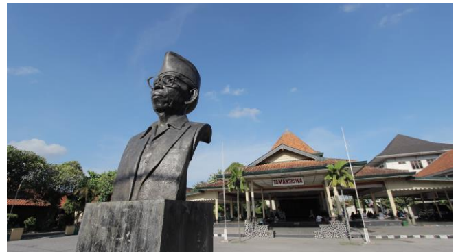
Gambar 1. Sekolah Taman Siswa

Dari foto diatas terlihat patung Ki Hadjar Dewantara yang terletak di depan pendopo Taman Siswa. Terlihat kesan jawa dari kompleks Taman Siswa dari pendopo yang berfungsi untuk menerima tamu berkumpul untuk pertemuan ataupun rapat serta keperluan yang lain. Majelis Luhur Taman Siswa sering mengadakan pertemuan - pertemuan di pendopo terutama saat peringatan hari pendidikan nasional.