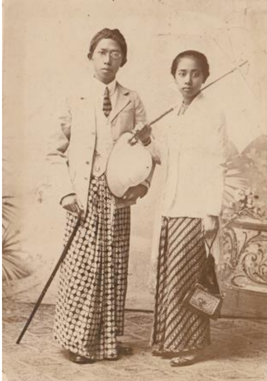
Gambar 2. Ki Hadjar dan Nyi Hadjar

Foto Ki Hadjar dan Nyi Hadjar yang sedang berpakaian adat Jawa. Terlihat sosok Ki Hadjar yang sangat terlihat santun dan bersahaja