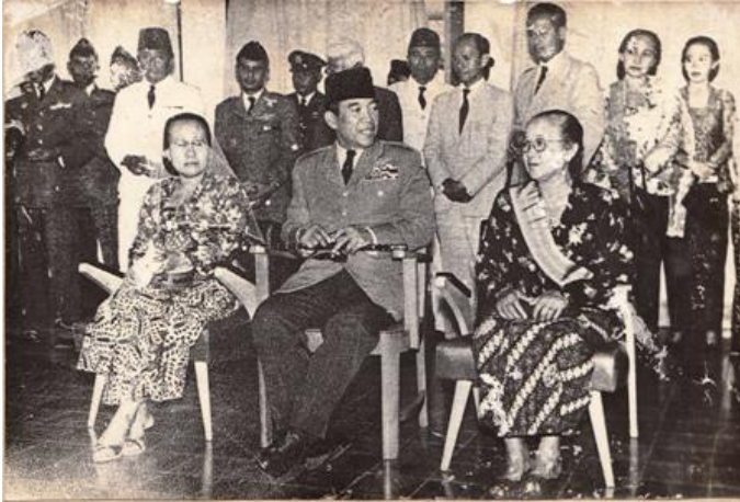
Gambar 5. Kunjungan Ir. Soekarno ke Taman Siswa

Ki Hadjar Dewantara adalah guru bagi presiden pertama Indonesia Ir. Soekarno dan beliau sangat menghormati sosok Ki Hadjar