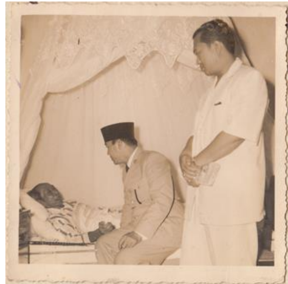
Gambar 7. Presiden Ir. Soekarno menjenguk Ki Hadjar saat sedang sakit

Pribadi sosok Ki Hadjar yang nasionalis terlihat dari pribadi dan pakaian yang dikenakan sewaktu diasingkan di Belanda masih menjunjung tinggi adat pakaian Jawa.