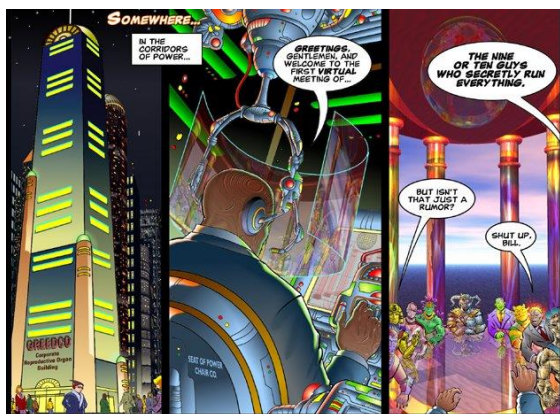
Gambar 2. ArgonZark!

Tetapi Parker tidak sendiri ketika itu. Kartunis dengan aliran alternatif-Psychedelic bernama Cat Garza meluncurkan websitenya di tahun 1996 dengan nama “ Magic Inkwell ” atau Jesse Reklaw dengan webcomic-nya Slow Wave yang diluncurkan pada tahun 1995 dan masih berjalan hingga sekarang. Perlu dicatat bahwa Jesse Reklaw telah membawa webcomic pada tahap lanjut mengenai interaksi antara pembaca dan komikus. Premis komik Reklaw cukup sederhana namun menarik, yaitu mengajak pembaca mengirimkan deskripsi tentang mimpi mereka melalui email, kemudian diterjemahkan oleh Reklaw dalam komik strip empat panel. Interaksi ini membuat para pembaca merasa terlibat dan menjadi bagian penting dari sebuah proses kreatif pembuatan komik.