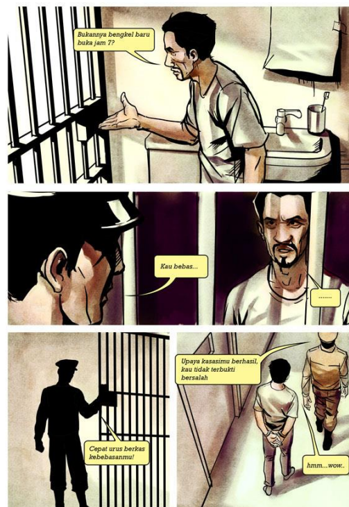
Gambar 7. Contoh halaman webcomic