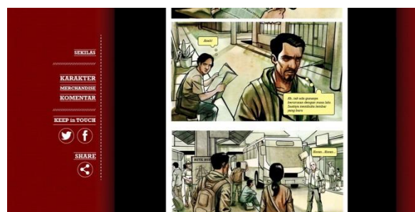
Gambar 4. Aplikasi pada website