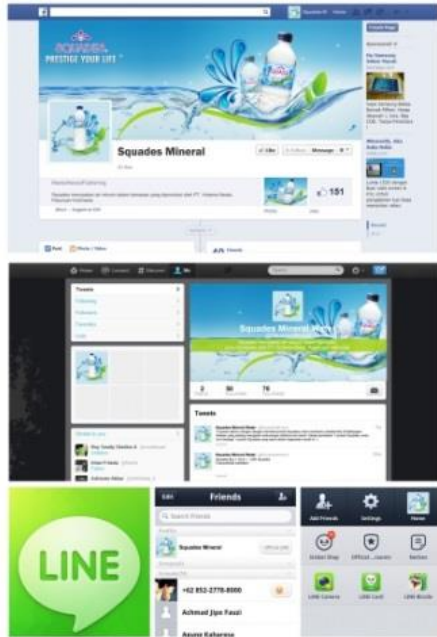
Gambar 8. Sosial Media Squades

Selain itu Squades juga menggunakan beberapa media tersendiri untuk mendukung pergerakan CSR. Media primer yang digunakan yaitu Billboard , Iklan Radio, Iklan Koran, dan Label Tag .