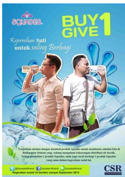
Gambar 14. Poster CSR Squades