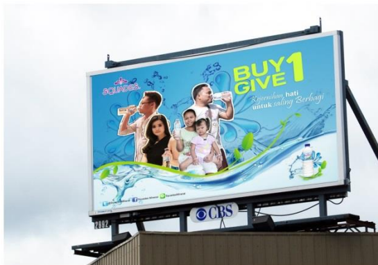
Gambar 9. Billboard CSR Squades

Selain itu Squades juga menggunakan beberapa media tersendiri untuk mendukung pergerakan CSR. Media primer yang digunakan yaitu Billboard , Iklan Radio, Iklan Koran, dan Label Tag .