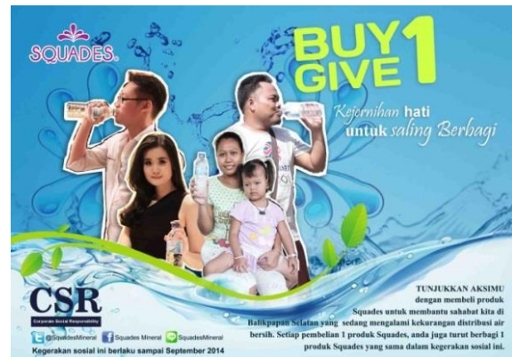
Gambar 11. Iklan Koran CSR Squades