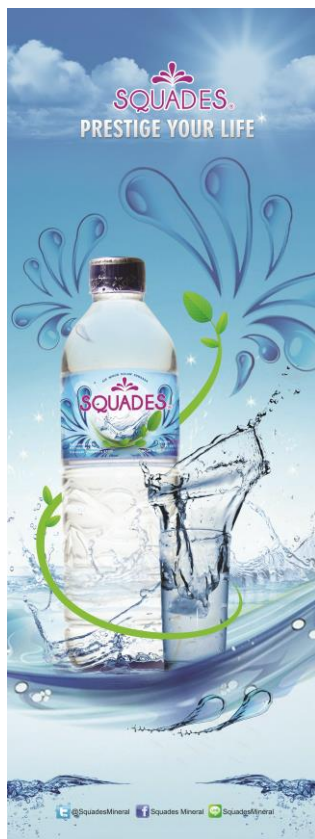
Gambar 4. X-banner Squades

Sedangkan media sekunder yang digunakan yaitu x-banner, poster, spanduk warung, dan sosial media berupa Facebook , Twitter dan Line .