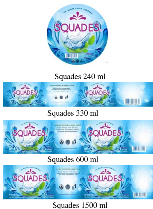
Gambar 1. Label Squades

Berikut merupakan hasil rebranding dari desain label produk Squades :