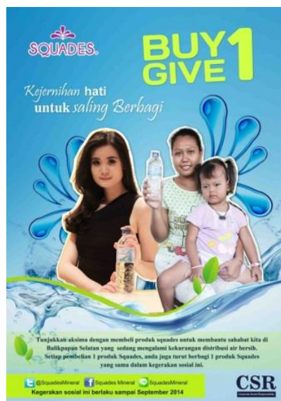
Gambar 15. Poster CSR Squades