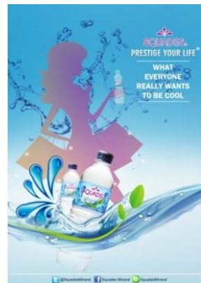
Gambar 6. Poster Squades