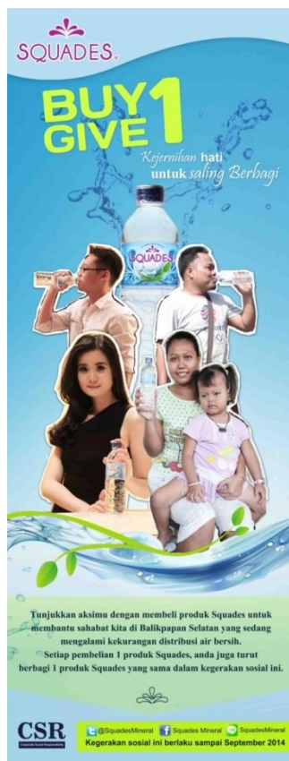
Gambar 13. X-banner CSR Squades

Sedangkan media sekunder yang digunakan yaitu x-banner, poster, dan flyer