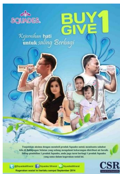
Gambar 16. Flyer CSR Squades