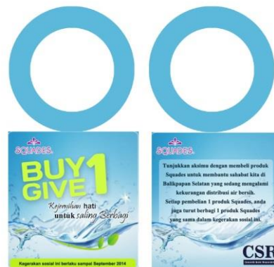
Gambar 12. Label Tag CSR Squades