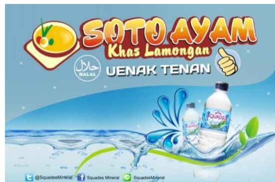
Gambar 7. Spanduk Warung Squades