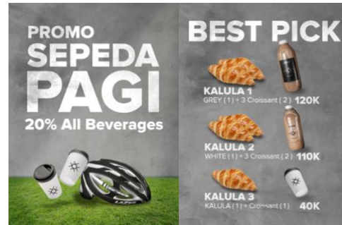
Gambar 5. Final Poster Kopi Kalula