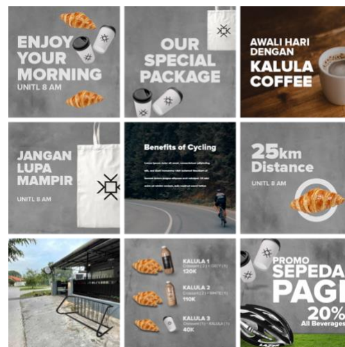
Gambar 6. Final Sosial Media Kopi Kalula