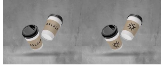
Gambar 2. Final Sleeve Kopi Kalula