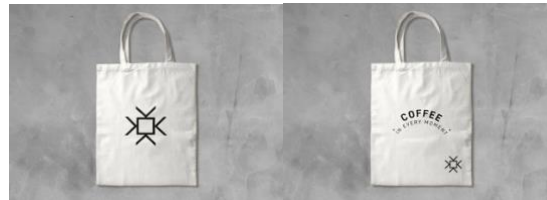
Gambar 4. Final Totebag Kopi Kalula