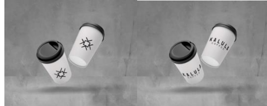
Gambar 3. Final Coffee Cup Kopi Kalula