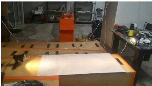
Gambar 5.1.3. Proses pemanasan dengan Lampu Halogen 50 watt

Pada spesimen Q, R, S, dan T dengan komposisi jumlah kertas yang besar dan air banyak yang menyebabkan memerlukan waktu cukup lama agar spesimen kering dengan sempurna, tetapi menghasilkan spesimen yang memiliki massa yang stabil dan kuat serta tidak mudah patah saat mengalami uji banting. Sedangkan pada spesimen yang menggunakan banyak Gypsum menghasilkan spesimen yang berat dan mudah pecah. Jika spesimen banyak menggunakan lem putih maka saat proses pengeringan akan menempel pada cetakan dan akan susah untuk dilepas.