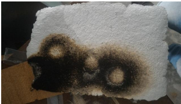
Gambar 4.2.11. Percobaan uji coba pembakaran partisi kertas dengan alat las suhu tinggi selama 10 menit.

Kelemahan : memerlukan waktu untuk meratakan cetakan, perlu tenaga lebih untuk memeras kadar air dalam adonan kertas, waktu penjemuran kertas lama, cetakan sangat rapuh dan mudah rusak.