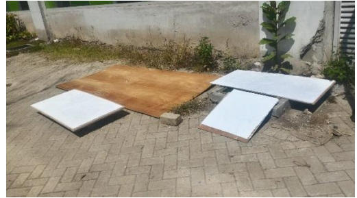
Gambar 5.1.4.. Proses penjemuran dengan panas cahaya matahari.