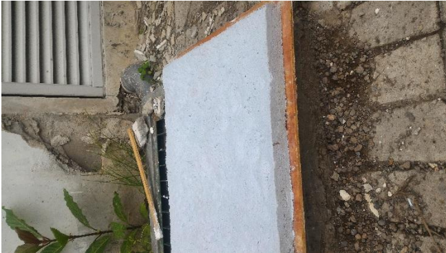
Gambar 4.2.10. Cetakan Kertas dilepas dari Cetakan Balok.

Kelebihan : Hasil Cetakan persegi sempurna, mudah di buat, waktu pencampuran dan meletakkan pada cetakan sangat cepat, proses pencetakan dan pelepasan mudah dan praktis.