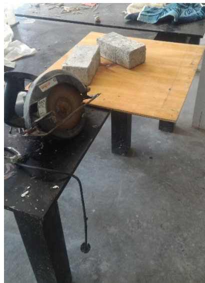
Gambar 4.2.1. Proses pemotongan Multiplek dengan gergaji mesin