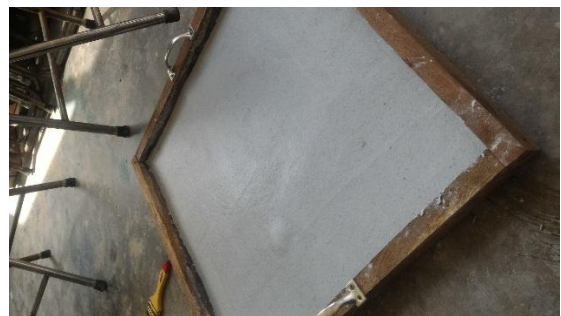
Gambar 4.2.9. Proses pencetakan dengan cetak Balok