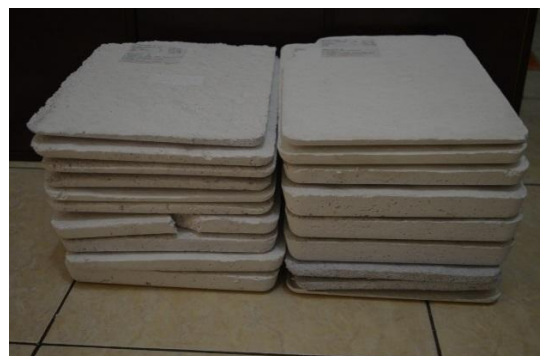
Gambar 5.1.2. spesimen dari limbah kertas