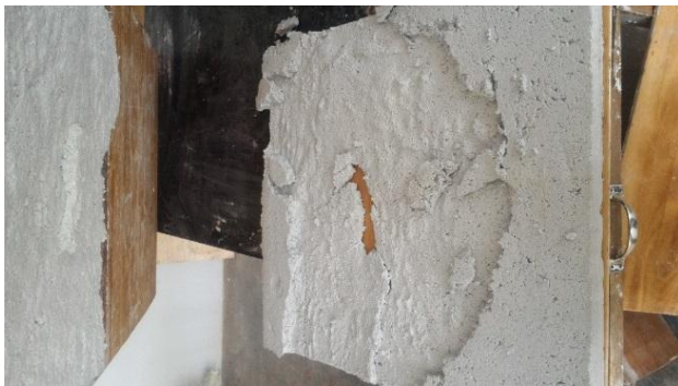
Gambar 4.2.12. Hasil cetakan yang gagal dikarenakan kadar air masih banyak dan lengket karena campuran lem putih sehingga saat di lepas dari alas ada bagian yang menempel.