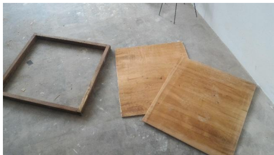
Gambar 4.2.5. Cetakan Balok beserta alas cetakan ukuran 60 x 60 cm