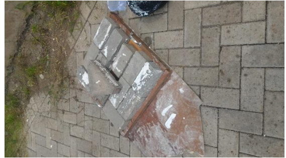
Gambar 4.2.7. tutup cetakan di beri pemberat untuk menekan alas etakan sehingga memeras kadar air dalam adonan kertas berkurang.