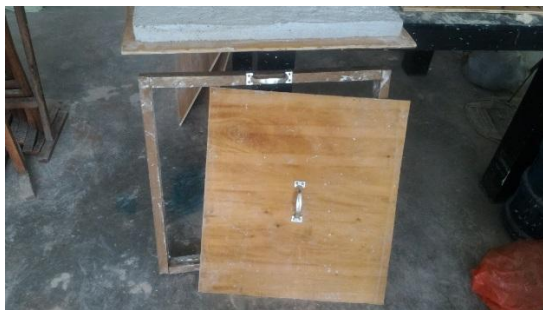
Gambar 4.2.6. Cetakan di beri pegangan agar mudah saat di tarik dalam proses pencetakan.