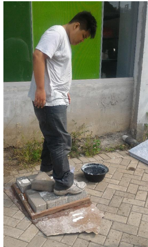
Gambar 4.2.8. Proses Pencetakan dan menekan kadar air dalam adonan kertas.