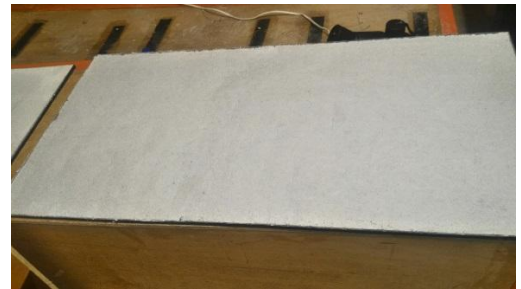
Gambar 5.1.5. Spesimen V skala 1:1

Pada percobaan spesimen ini merupakan hasil pengukuran dari bagan spesimen Tabel 4.4.1. yang dimana didapatkan komposisi dari analisis percobaan spesimen sebelumnya dengan ukuran komposisi Bubur kertas 4680 gr, Gypsum 1860 gr, Lem putih 630 gr, dan Air 1800 gr.