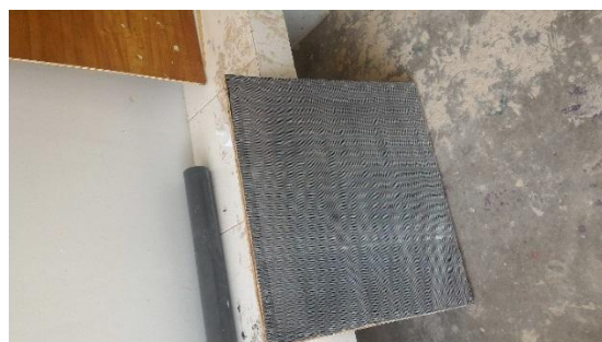
Gambar 4.2.3. Cetakan kawat dan kain Ukuran 60 x 60 cm