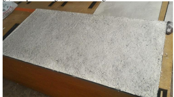
Gambar 5.1.6. spesimen W skala 1:1

Pada percobaan spesimen ini merupakan hasil pengukuran dari bagan spesimen Tabel 4.4.1. yang dimana didapatkan komposisi dari analisis percobaan spesimen sebelumnya dengan ukuran komposisi Bubur kertas 4680 gr, Gypsum 1860 gr, Lem putih 630 gr, dan Air 1800 gr.