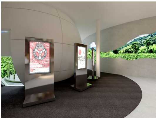
Gambar 10. Area VR

Pada ruang ini bertujuan untuk menjadi area serbaguna yang dapat dipakai aktivitas-aktivitas pengunjung untuk lebih mengenal kopi, contoh penerapan ruangan ini digunakan sebagai area lelang kopi, area lomba kopi dan workshop-workshop tentang kopi Indonesia.