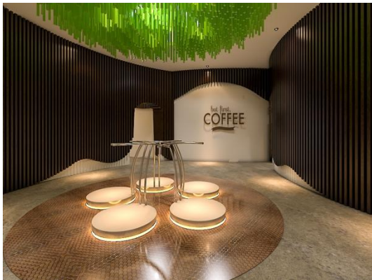
Gambar 5. Area VR

Pada area proses ini juga memiliki kekurangan pada dinding yang terlalu monoton dan kurangnya pemanfaatan dinding sebagai display informasi yang ada.