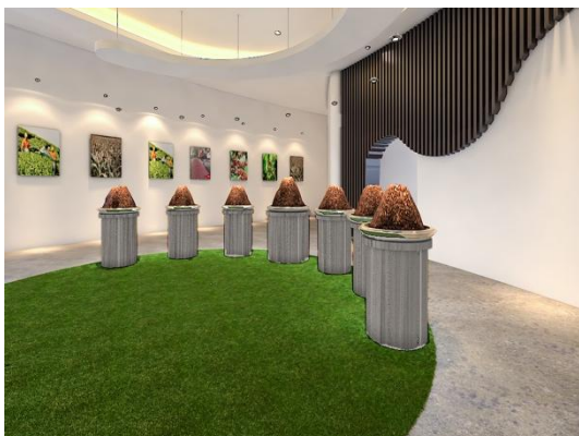
Gambar 6. Area Rollaas

Pada Area VR ini memiliki kekurangan pada kapasitas yang sangat minim, sehingga kurang memaksimalkan penggunaan ruang, dan juga dinding yang kurang diolah untuk pemanfaatan informasi.