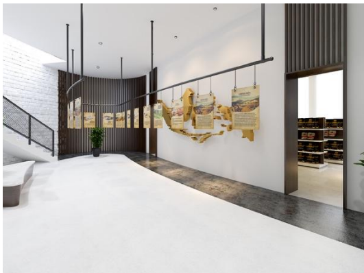
Gambar 11. Area Rollaas

Area VR dirancang untuk memberikan pengalaman secara interaktif pada pengunjung, sehingga mengetahui fakta-fakta betapa berharganya kopi Indonesia. Area VR diibaratkan sebagai jendela masa depan kopi Indonesia. Bentuk bola pada area VR ini melambangkan dunia dimana informasi akan menjadi salah satu langkah awal untuk mengenali segala sesuatu dalam kasus ini, kopi Indonesia. Secara fungsional pengunjung akan disodorkan dengan gambaran masa depan kopi Indonesia yang semestinya dengan Virtual Reality .