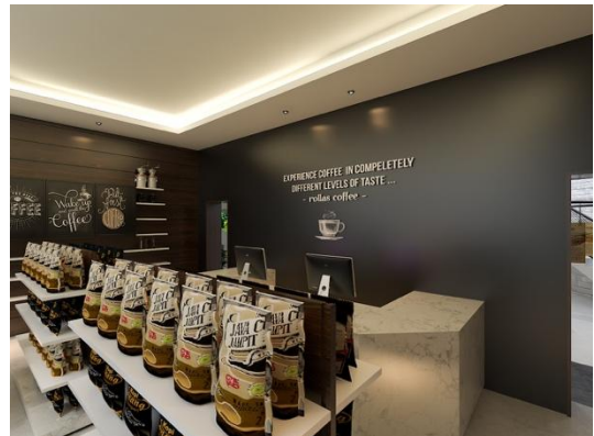
Gambar 13. Area Merchandise

Pada area café ini ditujukan agar para pengunjung dapat mendapatkan pengalaman yang lengkap, setelah mengerti semua informasi yang lengkap tentang kopi para pengunjung dapat langsung menikmati ' taste ' kopi yang telah diproses pada area café ini. Pada area café ini lebih mengusung suasana industri kopi dengan aplikasi desain yang menggunakan style industrial .