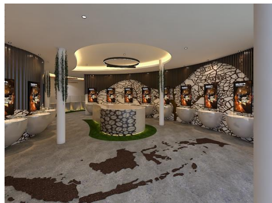
Gambar 3. Area Lobby

Pada area lobby ini memiliki kekurangan pada dinding yang terlalu ramai. Juga pada plafon yang kurang dalam pengolahan sehingga menjadikan galeri ini terkesan monoton.