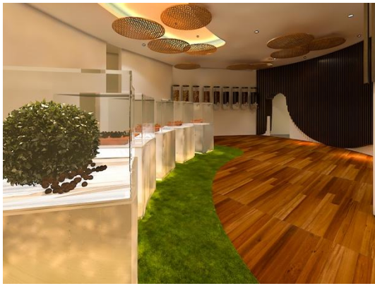
Gambar 4. Area Proses

Pada area proses ini juga memiliki kekurangan pada dinding yang terlalu monoton dan kurangnya pemanfaatan dinding sebagai display informasi yang ada.