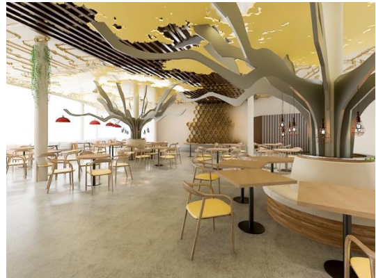
Gambar 12. Area Café

Area Rollaas ini ditujukan agar para pengunjung mengerti lebih dalam mengenai produsen lokal yang memproses kopi secara professional dan dengan kualitas yang mendunia. Selain itu juga berfungsi untuk mengusung nilai commercial pada galeri ini dimana produsen Rollaas dapat membawa kopi Indonesia ke masa depan kopi lebih cerah.