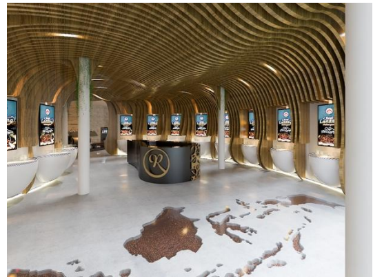
Gambar 7. Area Lobby

Pada area Lobby ini berfungsi untuk memberikan pengetahuan luas akan beragam kopi di Indonesia dengan 18 display area-area penghasil biji kopi arabika terbesar, dimana display tersebut membahas ketinggian, aroma, body, acidity, note taste. Indonesia menjadi citra utama dalam perancangan galeri ini sehingga peta pulau Indonesia pada lantai lobby main entrance ini sebagai point interest utama dalam galeri ini. Rancangan sebagai simbol transisi dalam lobby ini mengartikan tidak ada suatu hal yang tiba-tiba terbentuk dan jadi, tetapi melalui setiap proses yang sedikit demi sedikit menuju bentuk wujud lain.