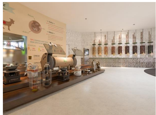
Gambar 8. Area Proses

Pada area Lobby ini berfungsi untuk memberikan pengetahuan luas akan beragam kopi di Indonesia dengan 18 display area-area penghasil biji kopi arabika terbesar, dimana display tersebut membahas ketinggian, aroma, body, acidity, note taste. Indonesia menjadi citra utama dalam perancangan galeri ini sehingga peta pulau Indonesia pada lantai lobby main entrance ini sebagai point interest utama dalam galeri ini. Rancangan sebagai simbol transisi dalam lobby ini mengartikan tidak ada suatu hal yang tiba-tiba terbentuk dan jadi, tetapi melalui setiap proses yang sedikit demi sedikit menuju bentuk wujud lain.