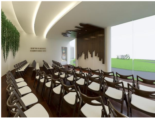
Gambar 9. Area Lelang

Pada ruang ini bertujuan untuk menjadi area serbaguna yang dapat dipakai aktivitas-aktivitas pengunjung untuk lebih mengenal kopi, contoh penerapan ruangan ini digunakan sebagai area lelang kopi, area lomba kopi dan workshop-workshop tentang kopi Indonesia.