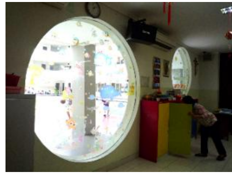
Gambar 7. Jendela ruang kelas TKK Santa Clara Surabaya