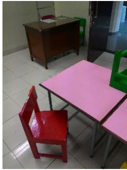
Gambar 5. Meja dan kursi siswa TKK Santa Clara Surabaya

taman kanak-kanak pada umumnya. Meja berpengaruh penting pada kegiatan belajar mengajar, apabila ukuran minim maka akan membuat kegiatan belajar mengajar kurang efektif. Warna finishing dari top table meja menggunakan warna merah mudah. Penggunaan warna yang cerah membuat suasana ruang menjadi lebih meriah sehingga dapat menstimulasi anak agar beraktifitas, gembira, dan kreatif. Namun perlu diperhatikan juga karena warna yang cerah cepat membuat mata cepat lelah, sakit kepala dan tegang sehingga warna yang disarankan untuk mengurangi sakit kepala dan mata cepat lelah adalah penggunaan warna pastel.