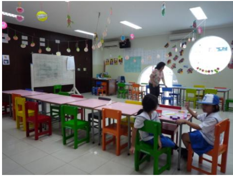
Gambar 7. CCTV pada ruang kelas TKK Santa Clara Surabaya