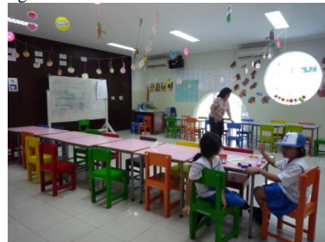
Gambar 8. AC pada ruang kelas TKK Santa Clara Surabaya

Penghawaan merupakan faktor yang cukup penting karena setiap ruangan perlu adanya proses pergantian udara. Penghawaan bisa secara alami dan buatan. Penghawaan alami bisa melalui ventilasi, sedangkan penghawaan buatan menggunakan campuran tangan manusia (AC, kipas, dll). TKK Santa Clara menggunakan penghawaan buatan dengan menggunakan AC single split sebanyak 2 unit pada setiap ruang kelas. Pergantian udara pada ruang kelas dilakukan pada saat jeda antara rombongan kelas satu dengan rombongan kelas lainnya. Pintu kelas dibuka selama kurang lebih 30menit sehingga udara di dalam bisa berganti.