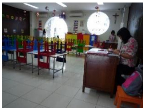
Gambar 4. Ruang kelas TKK Santa Clara Surabaya