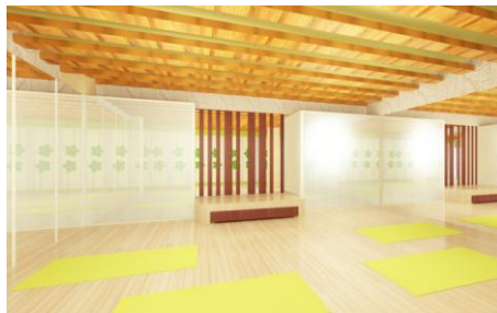
Gambar 16. Yoga and Aerobic Room

Yoga and Aerobic Room untuk melakukan kegiatan yoga maupun pilates dan juga kegiatan aerobic baik untuk customer maupun untuk umum.