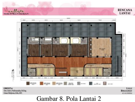
Gambar 8. Pola Lantai 2

Area masuk pada fasilitas ini melalui main entrance pada area lobby dan waiting room . Customer yang pertama kali datang disediakan area resepsionis untuk melakukan registrasi sebelum dimulainya perawatan. Di area main entrance ini juga tersedia tempat duduk pada area waiting room .