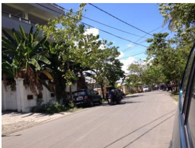
Gambar 3. Lokasi disekitar objek perancangan (Barat)