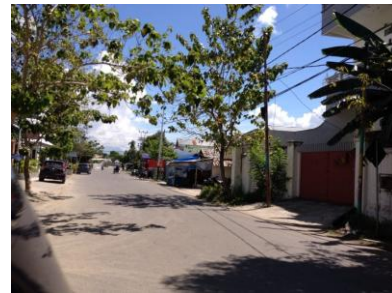
Gambar 4. Lokasi disekitar objek perancangan (Timur)

Lokasi site ini menghadap kearah Utara dan terletak pada kawasan yang strategis karena berada di tengah kota. Objek perancangan ini juga berada pada kawasan yang cukup aktif dan produktif.