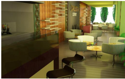
Gambar 23. Cafeteria