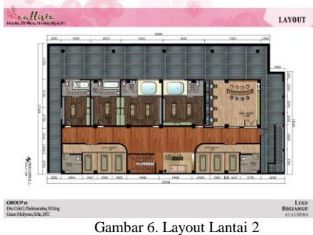
Gambar 6. Layout Lantai 2

Berikut perspektif 3D fasilitas yang disediakan: