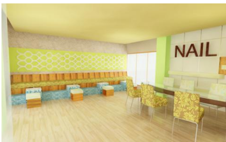
Gambar 17. Manicure Area

Area ini merupakan area perawatan body spa terbagi dalam beberapa ruangan yang berkapasitas satu orang ( single person ) dan untuk dua orang ( couple room ).