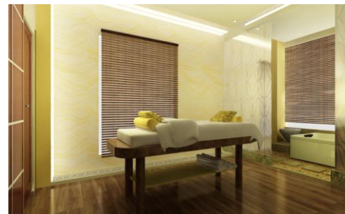
Gambar 19. Spa Room

Yoga and Aerobic Room untuk melakukan kegiatan yoga maupun pilates dan juga kegiatan aerobic baik untuk customer maupun untuk umum.