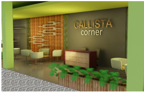
Gambar 22. Cafeteria