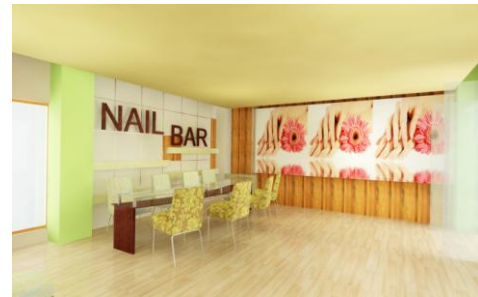
Gambar 18. Manicure Area

Gym Area berada di lantai 1, diperuntukkan untuk customer spa dan juga berlaku untuk publik. Di area ini tersedia beberapa alat kebugaran seperti treadmill dan alat untuk melatih otot.