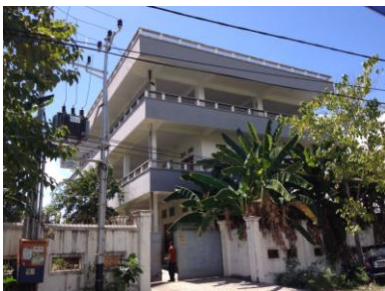
Gambar 2. Façade Objek Perancangan