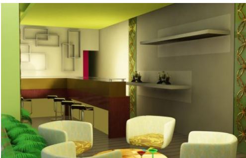
Gambar 24. Cafeteria

Area cafeteria diperuntukkan customer maupun dibuka untuk umum. Area cafeteria merupakan area semi outdoor . Di cafeteria ini disediakan makanan sehat bagi para pengunjung.