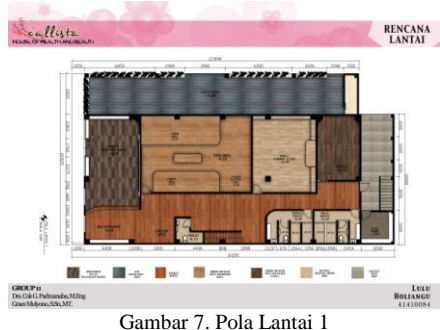
Gambar 7. Pola Lantai 1