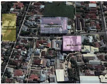
Gambar 1. Situasi Site Plan Objek Perancangan