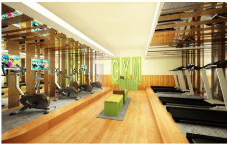
Gambar 14. Gym Area

Gym Area berada di lantai 1, diperuntukkan untuk customer spa dan juga berlaku untuk publik. Di area ini tersedia beberapa alat kebugaran seperti treadmill dan alat untuk melatih otot.