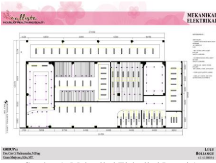
Gambar 9. Mekanikal Elektrikal Lantai 1

Area masuk pada fasilitas ini melalui main entrance pada area lobby dan waiting room . Customer yang pertama kali datang disediakan area resepsionis untuk melakukan registrasi sebelum dimulainya perawatan. Di area main entrance ini juga tersedia tempat duduk pada area waiting room .