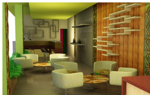
Gambar 21. Cafeteria