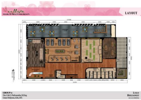
Gambar 5. Layout Lantai 1