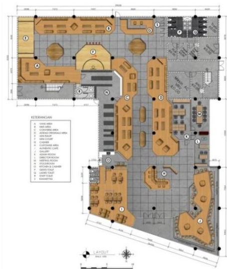
Gambar. 1. Layout Sneakers Addict Center

Layout perancangan ini didominasi oleh material semen plesteran dan dikombinasikan dengan warna kayu yang natural yang makin menyelaraskan perpaduan warna yang dihasilkan.