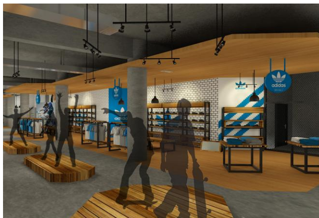
Gambar. 3. Adidas Originals Area

Penggunaan material pada mebel display menggunakan perpaduan kayu dengan besi hollow dengan minim finishing ,hanya dengan finishing politur dan coating doff . Desain mebel keseluruhan menggunakan bentukan geometris sesuai dengan konsep yang digunakan.