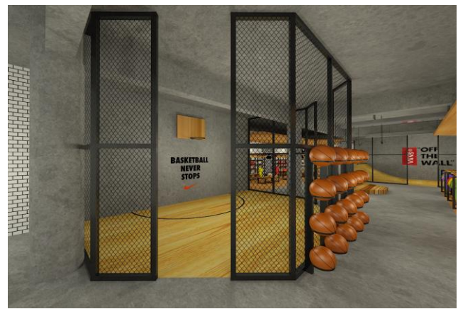
Gambar. 4. Mini Court

Dalam perancangan ini juga terdapat fasilitas Mini Court dan Mini Ramp dimana area ini berupa sebuah fasilitas bola basket dan ramp skateboard mini untuk para pengunjung [7]. Dari kedua fasilitas ini memang disediakan untuk merasakan langsung ketika ingin membeli sebuah sneaker . Semacam simulasi ringan yang menjadi daya tarik tersendiri dalam perancangan ini.