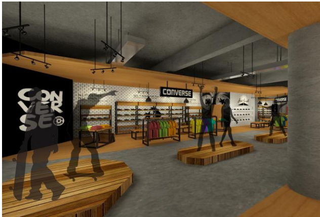
Gambar. 2. Converse Area

Store dirancang dengan suasana industrial dengan menghadirkan lantai dari cor semen dikombinasikan dengan material kayu serta material besi pada display dan dinding yang menggunakan keramik yang disusun motif bata. Plafond yang di ekspose tanpa penutup sehingga terlihat struktur balok pada langit plafond. Kesan industrial semakin kental dengan penggunaan lampu gantung yang biasa dipakai pada pabrik industri. Lalu dikombinasikan dengan beberapa lampu sorot untuk menonjolkan sneakers maupun barang yang ada di display dan lampu TL untuk membantu tata cahaya agar tidak terlalu gelap [1].