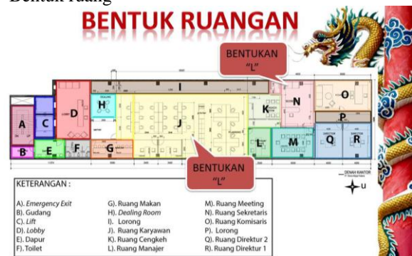
Gambar 6. Denah kantor