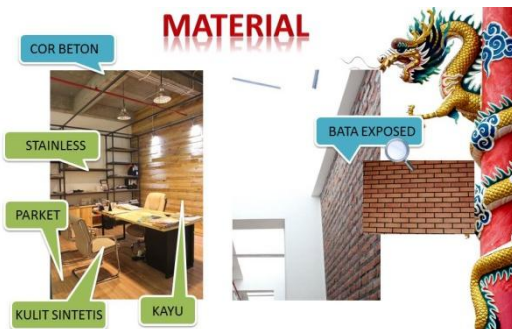
Gambar 11. Contoh aplikasi material.