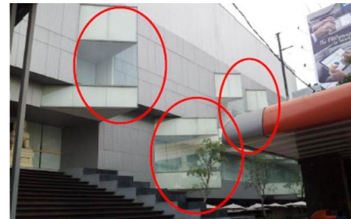
Gambar 5. Sudut tajam pada eksterior bangunan (merah)