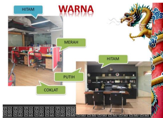
Gambar 12. Contoh aplikasi warna pada ruangan.