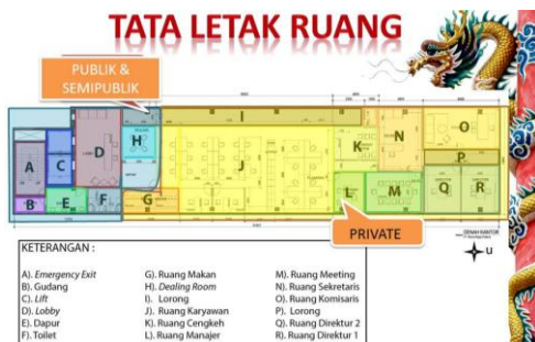
Gambar 8. Tata letak ruang berdasarkan zoning.

Dilihat dari gambar diatas, peletakan ruang sudah benar karena ruang bersifat publik dan semipublik berada di bagian depan kantor dan ruang yang bersifat private berada dibagian dalam kantor sehingga privasi kantor menjadi lebih terjaga. Hanya saja ada permasalahan pada emergencyexit , di kantor ini pintu emergencyexit (pada gambar dengan huruf A) berada di depan kantor saja, peletakan pintu ini menjadi tidak efektif jika harus mengevakuasi korban apabila terjadi bencana yang tidak di inginkan. Jadi sebaiknya pintu emergencyexit ditambahkan di bagian tengah kantor sehingga memudahkan proses evakuasi karena pengguna kantor yang berada dibagian dalam kantor tidak perlu berlari terlalu jauh untuk meraih pintu emergencyexit yang berada di depan.