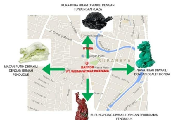
Gambar 1. Letak bangunan terhadap keadaan sekitar.