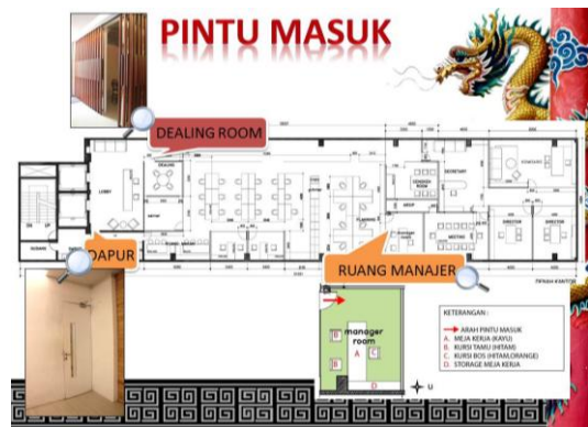
Gambar 9. Pintu masuk ruangan.