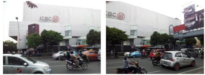
Gambar 4. Tampak depan bangunan kantor.