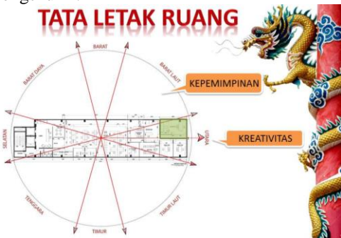
Gambar 7. Tata letak ruang berdasarkan Pa-Kua

Secara keseluruhan telah sesuai dengan prinsip Fengshui. Peletakan ruang disesuaikan dengan fungsi ruang dan berada pada sektor yang benar sehingga dipercaya dapat meningkatkan pengaruh positif pada kantor. Bisa dilihat pada gambar 7, sebagai contoh peletakan ruang komisaris (kotak hijau) berada pada sektor yang benar yaitu sektor kepemimpinan dan kreativitas karena seorang pemilik perusahaan atau kepala utama perusahaan harus memiliki jiwa kepemimpinan dan kreativitas yang tinggi.