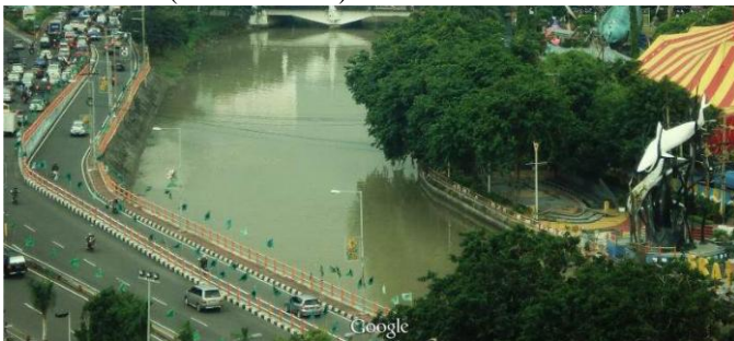
Gambar 3. Keadaan sungai Kali Mas yang melintasi kantor.