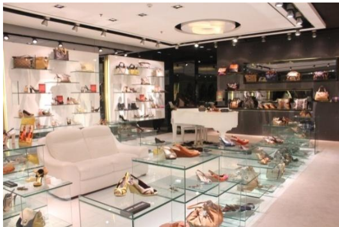
Gambar. 2. Interior Rotelli Galaxy Mall.

Kemudian, hal berikutnya yang akan dianalisis adalah warna dan material yang digunakan pada interior Rotelli. Warna-warna yang digunakan adalah abu-abu, hitam, putih dan emas. Warna emas hanya diaplikasikan pada logo Rotelli.