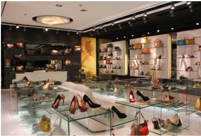
Gambar. 3. Interior Rotelli Galaxy Mall.

Pada material lantai menggunakan granit berwarna putih 80x80cm dan karpet abu-abu. Granit tersedia di berbagai ketebalan, pemasangan yang mudah dan cepat. Penampilan yang berkualitas dikombinasikan dengan perawatan yang mudah. Cocok untuk penggunaan tradisional dan kontemporer. Baik untuk area lalu lintas jalan padat. Karpet yang tahan lama. Terbaik digunakan untuk kualitas toko dan salon. [1] Karpet merupakan penutup lantai permanen yang memiliki kualitas dan tekstur visual yang kaya dan akan melengkapi berbagai jenis presentasi barang dagangan. Karpet tersedia dalam berbagai warna dan permukaan yang memberikan tampilan dimensi. Mereka tersedia dalam berbagai warnadan dapat dibersihkan dengan mudah. [2]