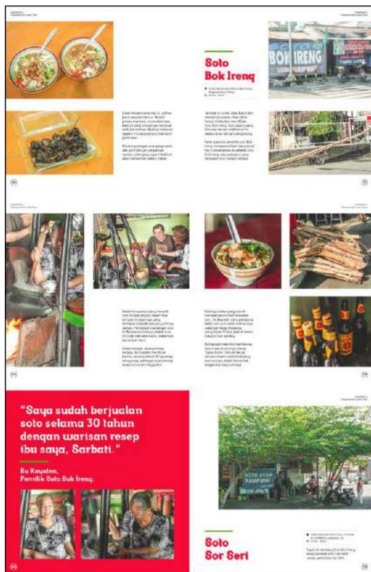
Gambar 11. Halaman 100-105