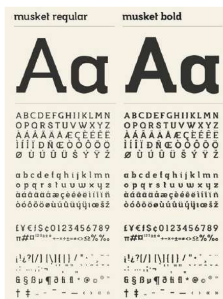
Gambar 3. Font Musket

Font yang akan digunakan untuk isi buku ini adalah Barlow. Font ini merupakan font bergaya sans serif , dipilih karena karakteristiknya yang tidak lebar, sehingga terlihat bersih dan nyaman dibaca.