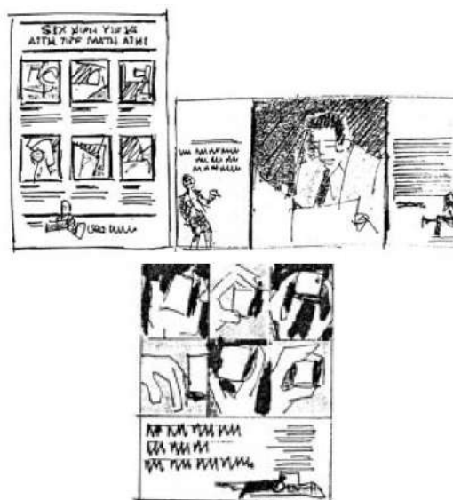
Gambar 2. Multipanel layout

untuk dibaca dan memiliki urutan yang jelas. (Nelson, 1989)