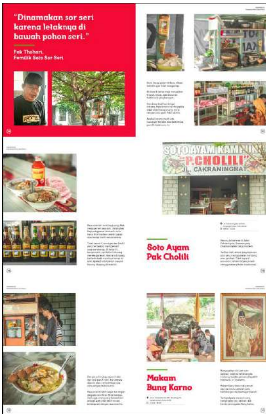
Gambar 12. Halaman 106-111