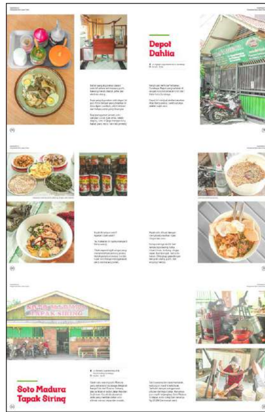
Gambar 14. Halaman 118-123