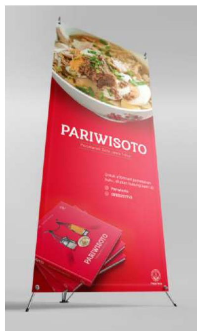
Gambar 21. Desain Pembatas Buku