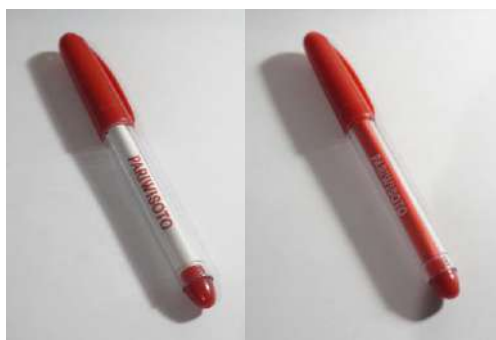
Gambar 18. Desain Bolpoin PARIWISOTO