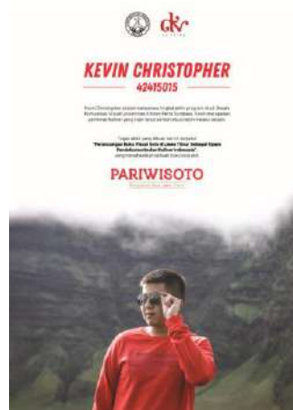
Gambar 22. Desain Poster Diri