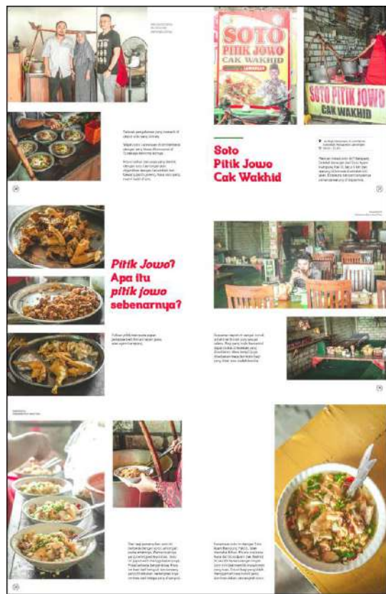
Gambar 10. Halaman 26-31