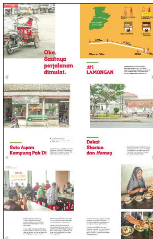
Gambar 7. Halaman 8-13