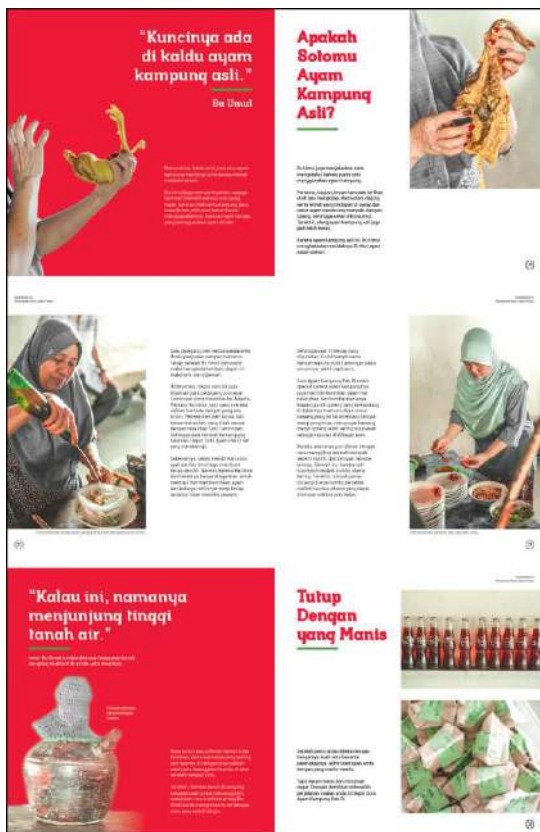
Gambar 9. Halaman 20-25