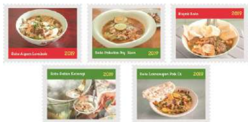
Gambar 19. Desain Stiker PARIWISOTO