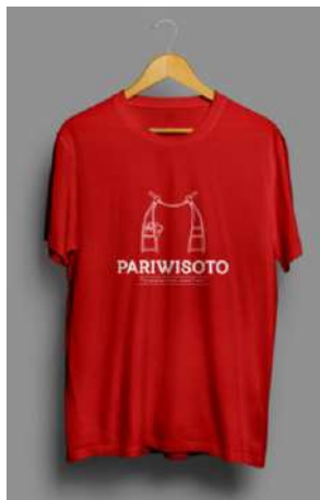
Gambar 16. Desain Kaus PARIWISOTO