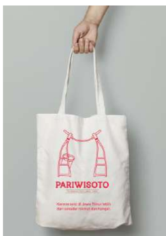
Gambar 17. Desain Tote Bag