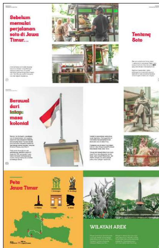
Gambar 6. Halaman 2-7