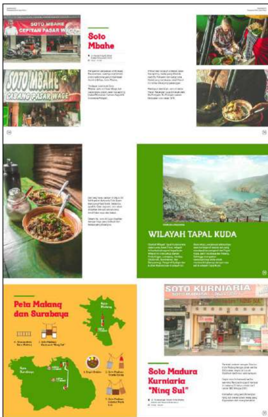
Gambar 13. Halaman 112-117