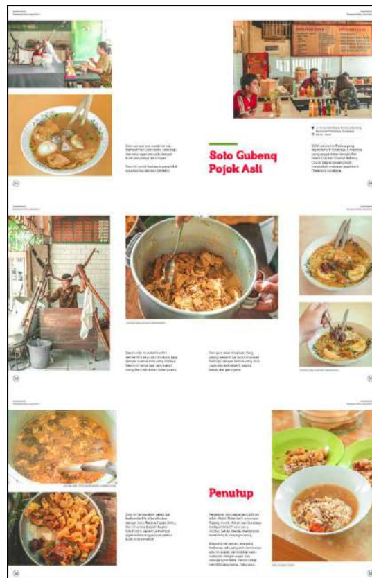
Gambar 15. Halaman 124-129