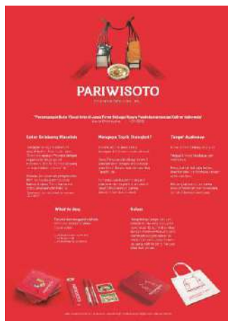
Gambar 21. Desain Poster Konsep