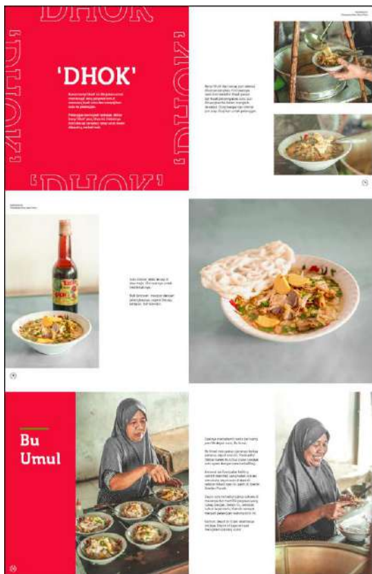
Gambar 8. Halaman 14-19